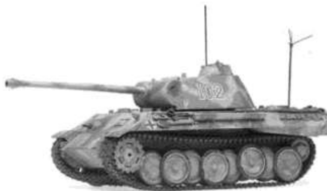
P-V. Panther (Párduc) közepes páncélos

A visszavonuló német katonák a balatonfüredi malom bejárata közelében két meghibásodott P-V. „Panther” (Párduc) harckocsijukat felgyújtották, s felrobbantották egy műhely-gépkocsijukat. 26