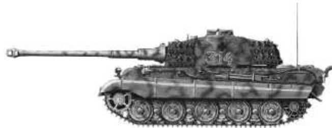
P-VI. Königtiger (Királytigris) nehézpáncélos

dó szovjet repülőátadások a távbeszélő vonalakat szétszaggatták. A hadinapló szótlansága azzal is összefügg, hogy déli 13 órakor a harcsoport-parancsnokság megkezdte áttelepülését a kijelölt Gyulakeszi községbe.