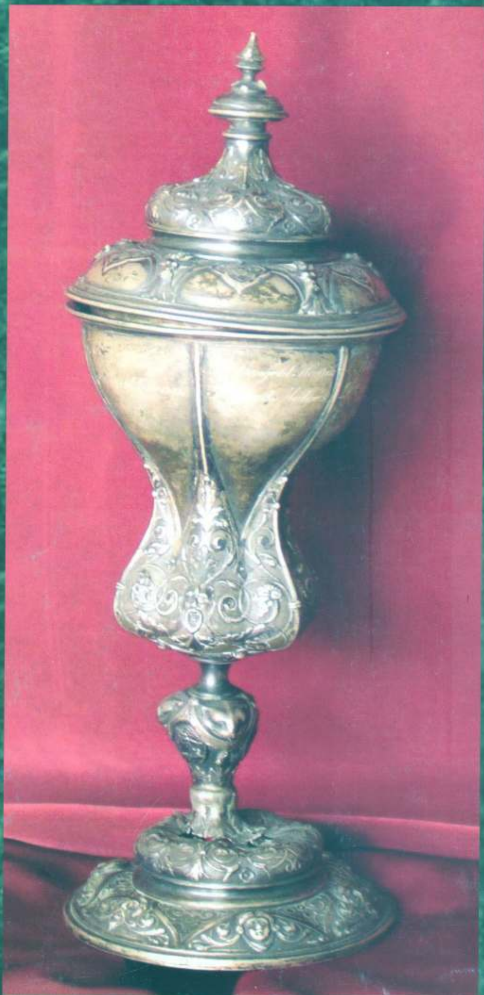
Écsy László 50 éves jubileumi ezüstsérlege