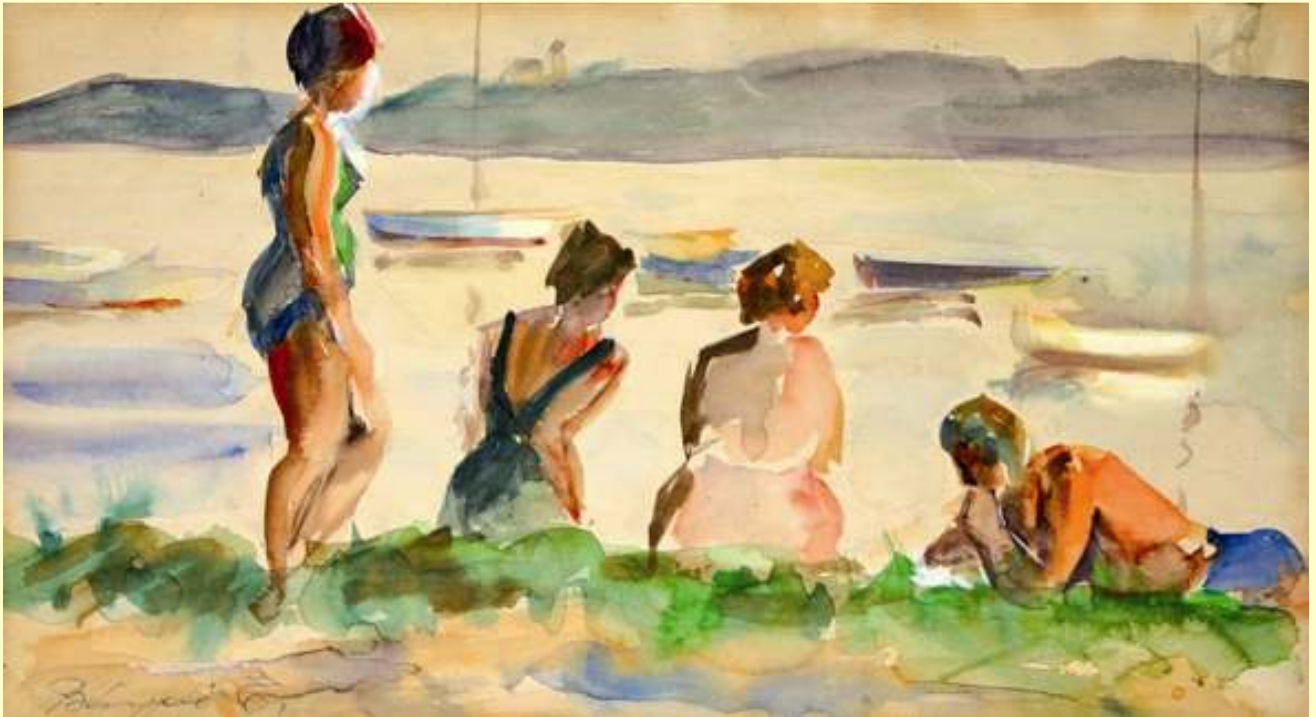
Bányai Erzsébet: Fürdőzők