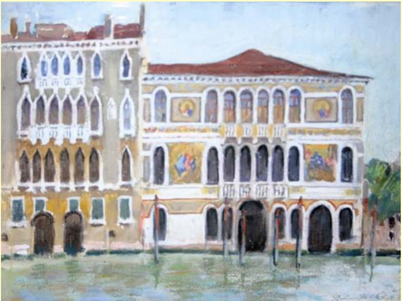
Bányai Erzsébet: Velencei paloták