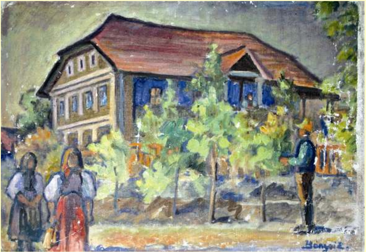
Bányai Erzsébet: Erdélyi életkép