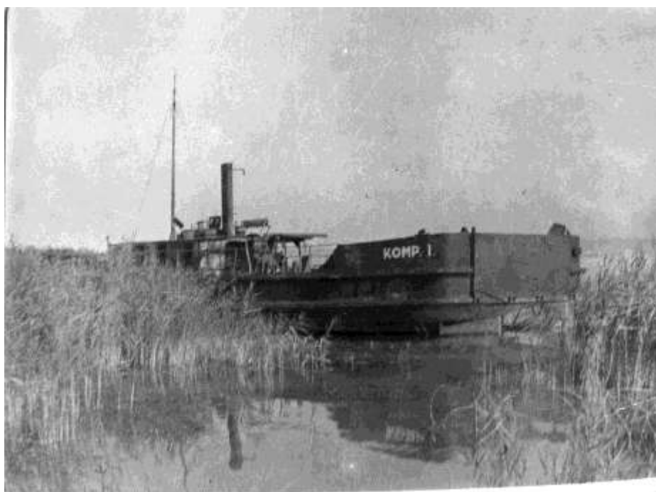
A partra futtatott komp