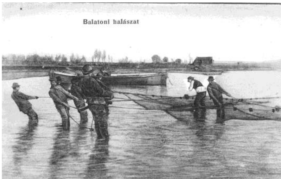
A háló bevonása

Arácsi lejáró; Sédút. A Balatonarácson keresztül folyó patak itt ömlik a Balatonba. Arácsi tisztás: 1. Nemesföldi dülő eleje.