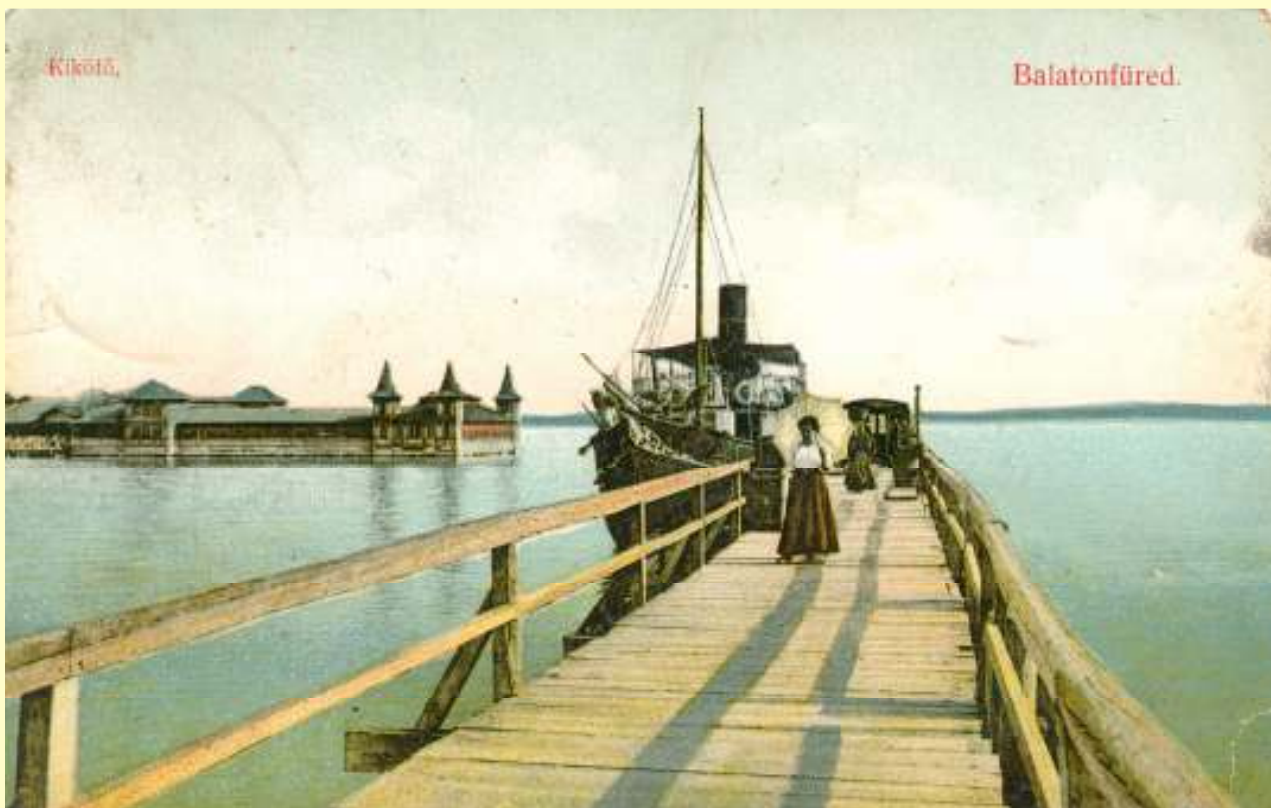
A füredi kikötő 1900 körül (képeslap, HTGy)