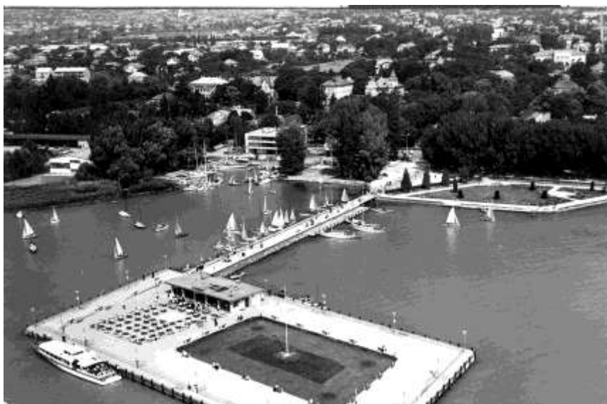
A kikötő 1970 körül, madártávlatból