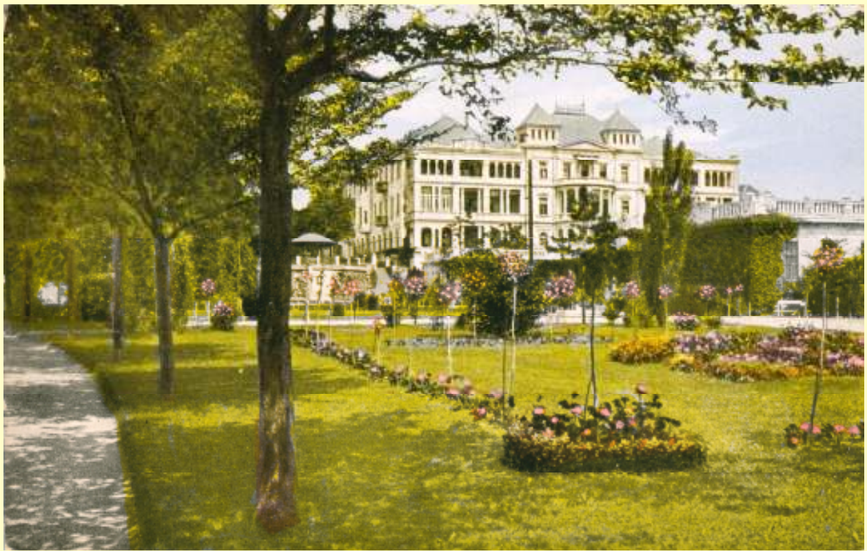
A szanatórium 1929-ben (képeslap, HTGy)