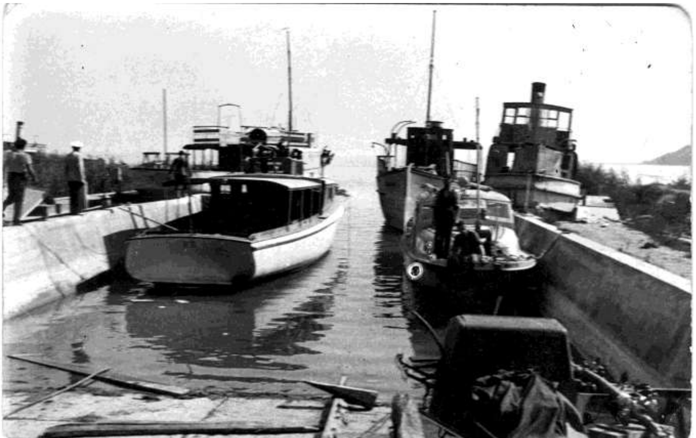
A megrongálódott hajók (Kisfaludy, Csongor, Kelén és Helka) kiemelésük után, a hajógyári kikötőben

Viszonylagos jólétünknek az áprilisi frontáttörés (Valójában március 16-án indult meg a szovjet el-lentámadás. – a szerk.) vetett véget. Amikor a szovjet csapatok elérték Balatonkenesét, a Füreden állomásozó német alakulatok fejvesztett kapkodásba kezdtek. A híradósok tekerték fel a drótokat, a visszavonulásban ekkorra már igen nagy gyakorlatra tettek szert. Minden mozgatható járművet elvittek. A szanatóriumban néma csönd honolt, mi, a kényszerűségből itt maradt menekültek szorongva vártuk a szovjet katonákat.