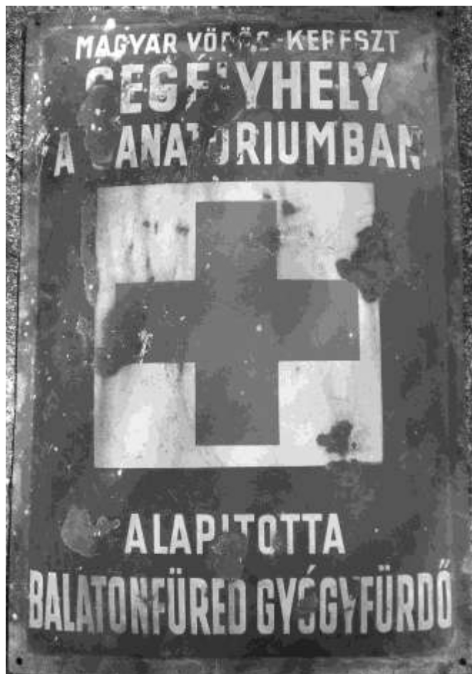
A Vöröskereszt tájékoztató táblája

1992 októberében a képviselő-testület által hozott határozat alapján 1993. január 1-jétől a közösi házban önálló irodát kapott a helyi szervezet.