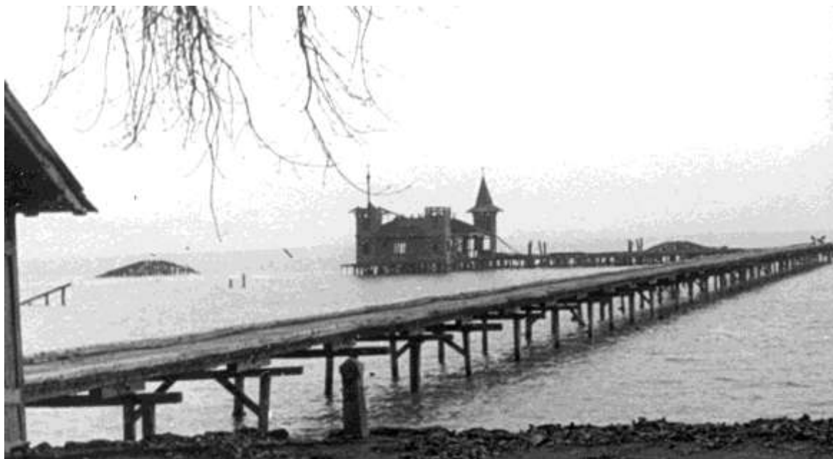
A felrobbant hidegfürdő