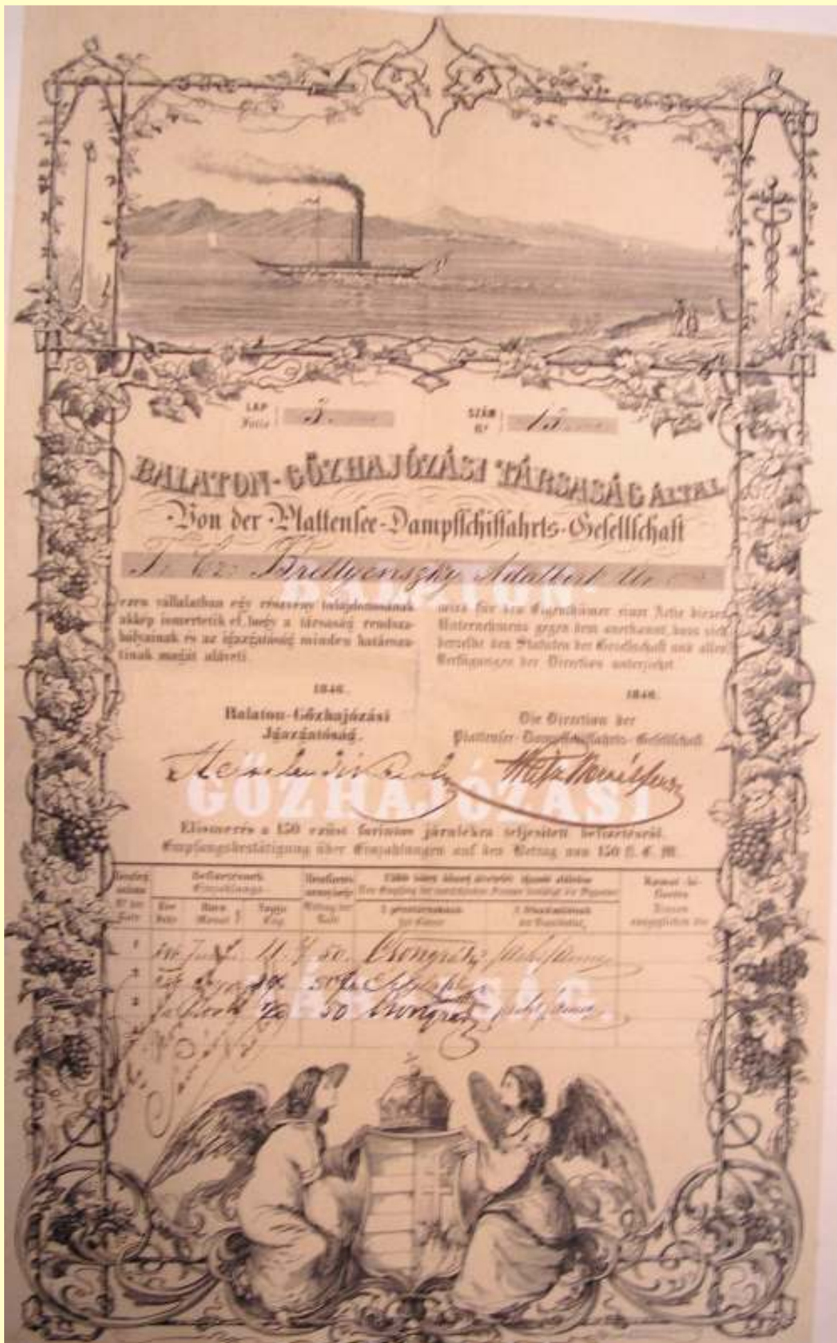
A Balatoni Gőzhajózási Társaság részvénye (1846) (HTGy)