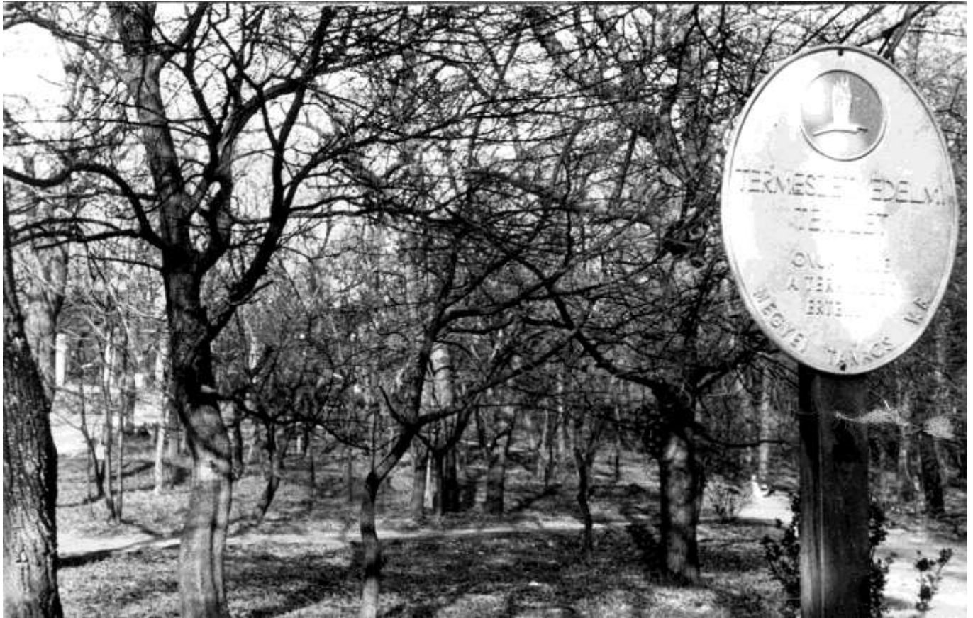
A Kiserdő egy részlete az 1980-as években