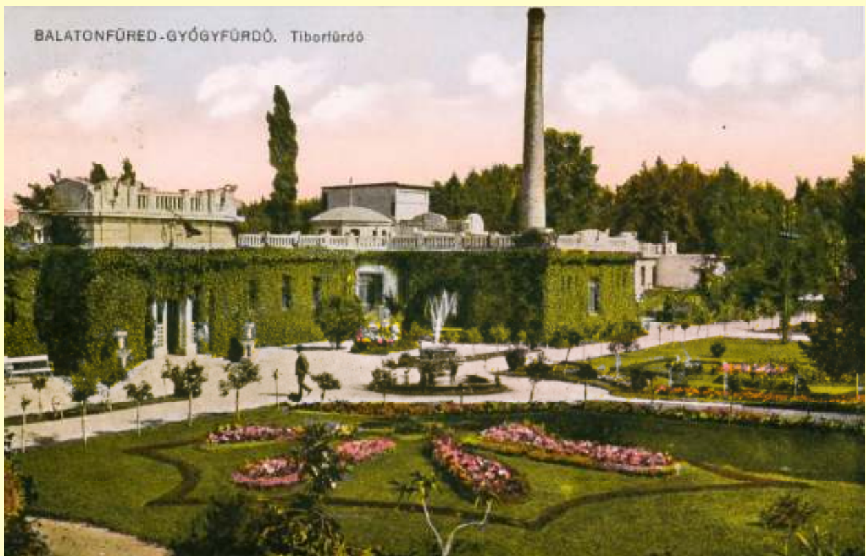
A Tibor-fürdő 1920 körül (képeslap, HTGy)