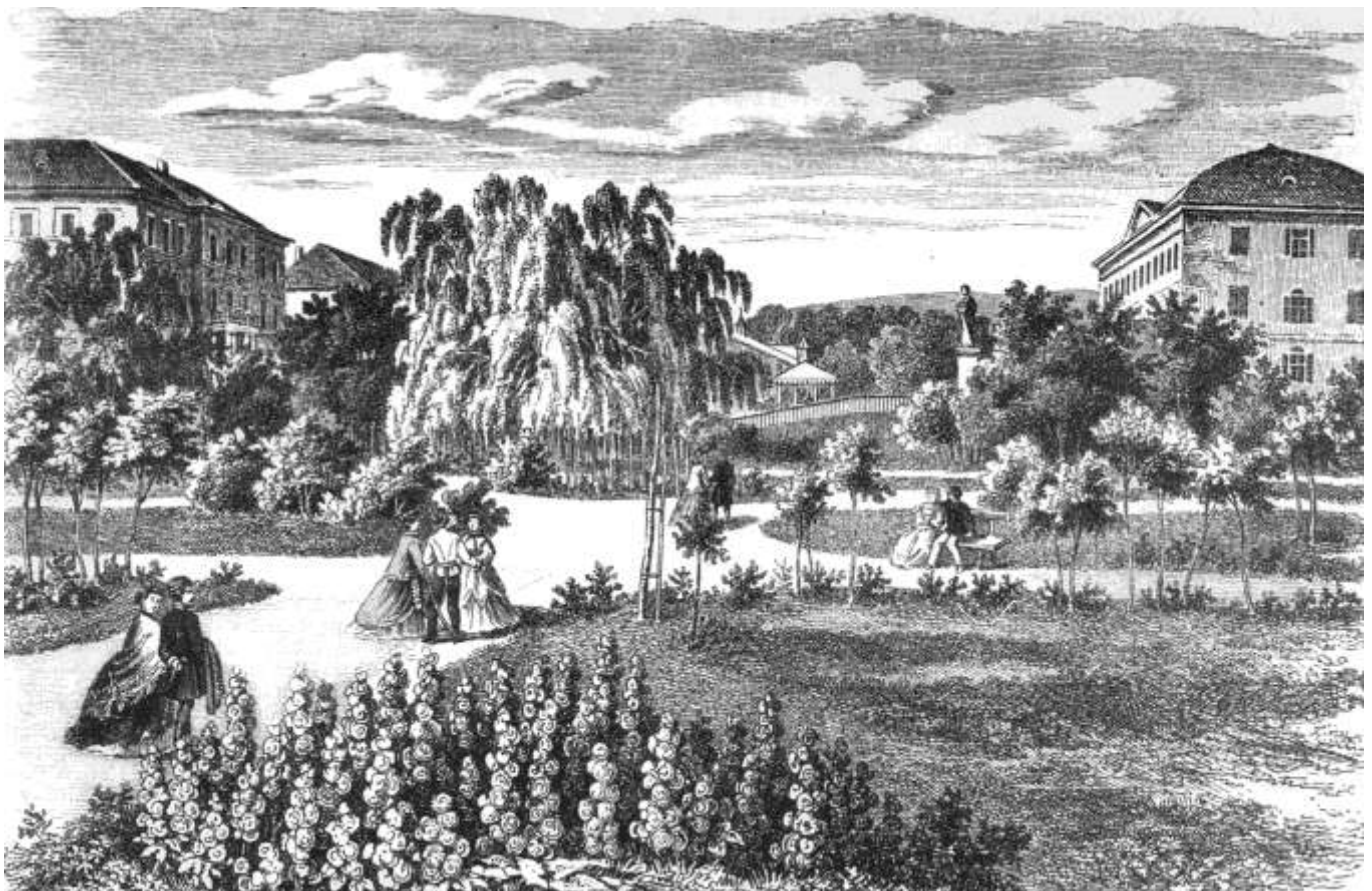
Az Angolkert részlete a 19. század közepén

Az 1850. évi instrukció az angolkerti hajdú kötelességeit 10 pontban foglalta össze. Az 1. pont szerint két söprővel és a lóhajtóval az utcákat, a sétatert, az angolkertet és a hidegfürdőkhöz vezető utat megsöpri. Gondoskodik az öntözésről. Vigyázza az angolkertet. Feladatainak nagyobb része azonban nem az angolkerthez kapcsolódott. 21