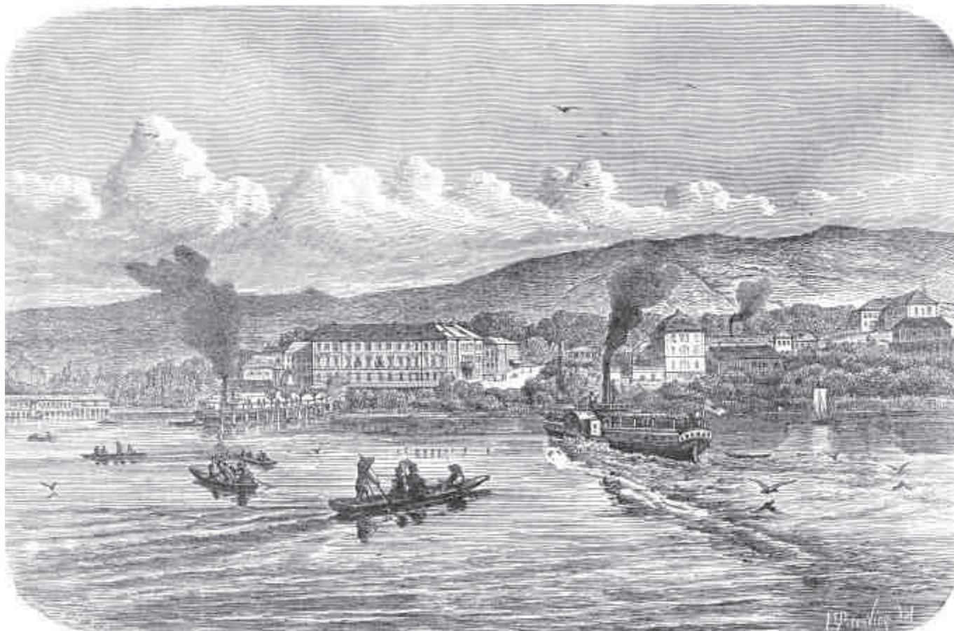
A fürdőtelep látképe 1866-ban

Ha jött, ráhuztak éjszakának idején, sok beteg háborgatására 2-3 dalt, mely drágába került, mint a gyógyszerárban a Chinin; s ha akadt olyan egyén, ki az éji zene utáni reggeli requisitóra 14 2-3 frtot mert adni, a magát már is fő-fő vajdának képzelő primásnak, – szépen visszaküldték! Hisszük, hogy az erélyes felügyelő e zaklatásnak nyomára jött eddig; orvosolva van a baj s a jövő évre felmondja nekik a – szállást. (Zala-Somogyi Közlöny. 1865. aug. 10. 23. sz.)