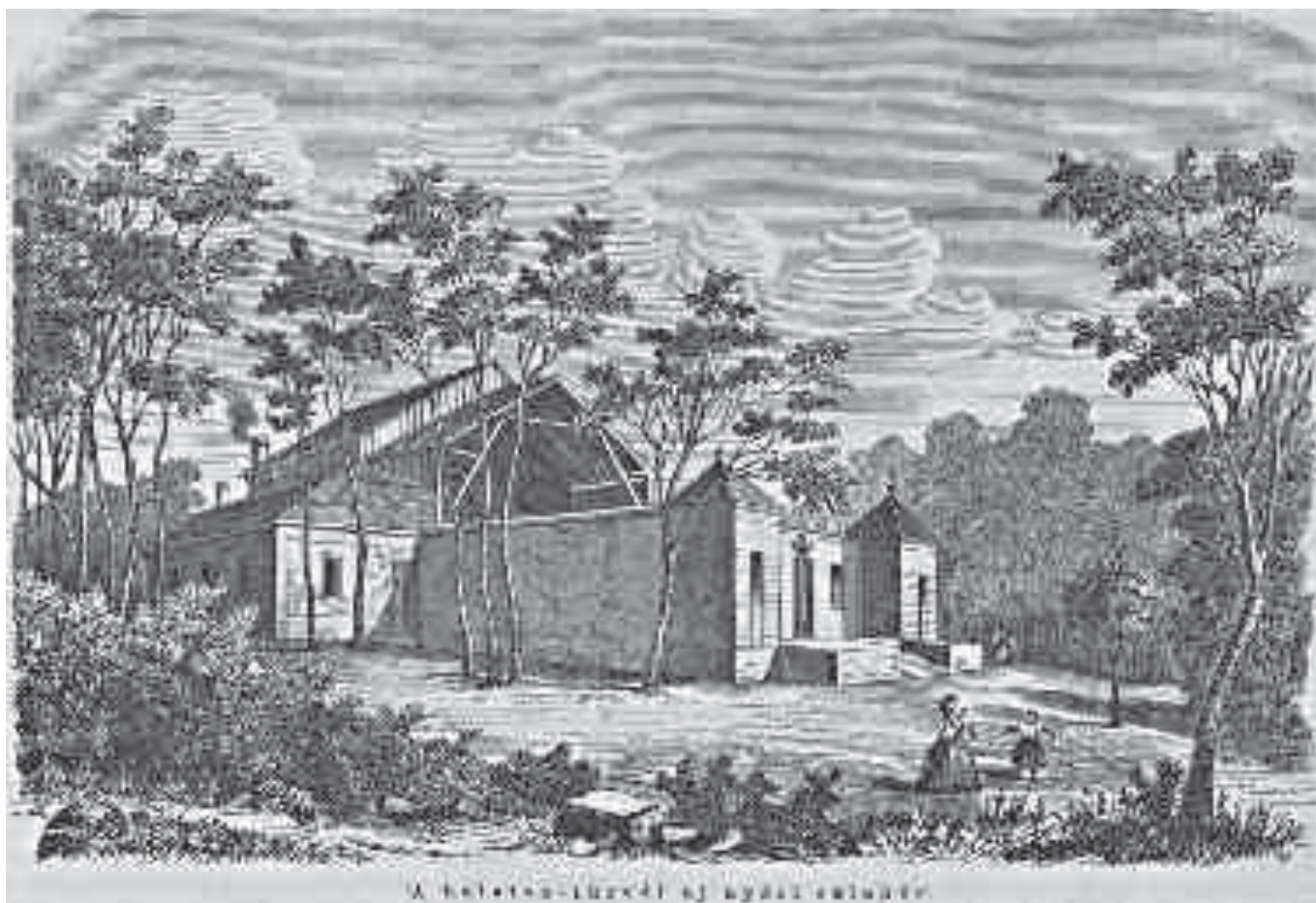
A még fedetlen nézőterű nyári színház 1862-ben