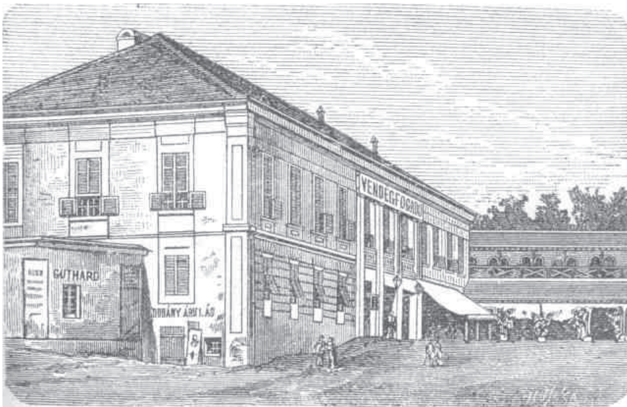
A vendégfogadó emeleti termében tartották 1848–1879 között az Anna-bálokat