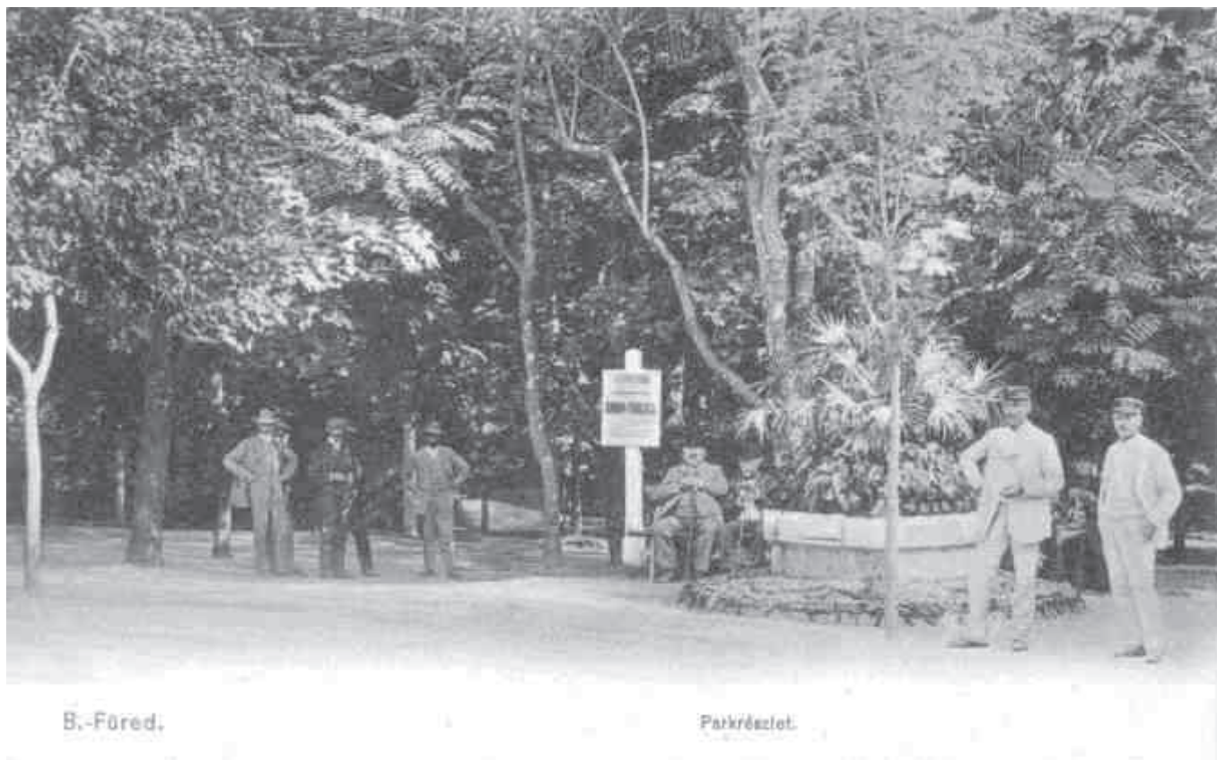
A füredi park részlete, az Anna-bálra hívó táblával (1905)