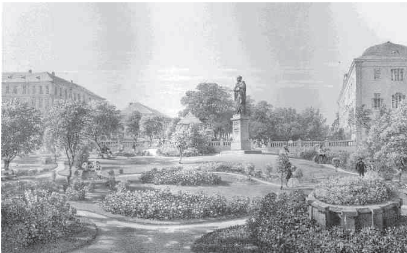
A füredi sétány részlete Kisfaludy Sándor 1860-ban avatott első szobrával