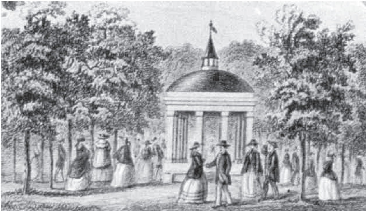
A savanyúvíz forrás kútja

Anna napja körül a szállások nem csak elfoglalják, de tömve az uri vendégek által. Roppant előkészületek mutatkoznak az öltözékek legváltozatosabb s fényesebb nemeiben, a tánczos és tánczosnők eligérkezéseiben, a legválogatottabb zene, étek és italok megszerzéseiben, szóval minden fény és kényelem nagyszerű előteremtésében. Minél inkább közeleg a vigalom kezdetének várva várt boldog órája, annyival hosszabb a még közben eső unatató és kinzó időcskének minden egyes és majd nem egész órává váló percze.