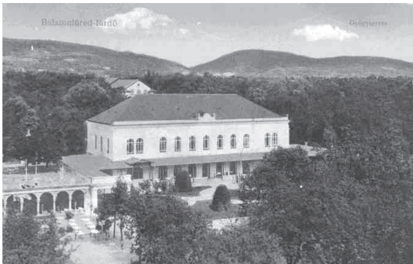
A Gyógyterem az 1900-as években