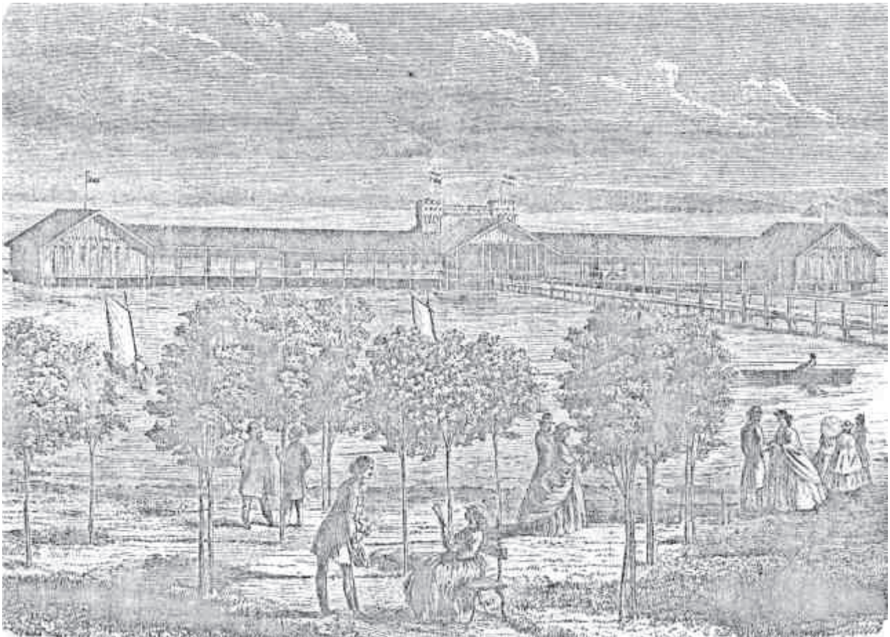
A parti sétány és a hidegfürdő 1866-ban