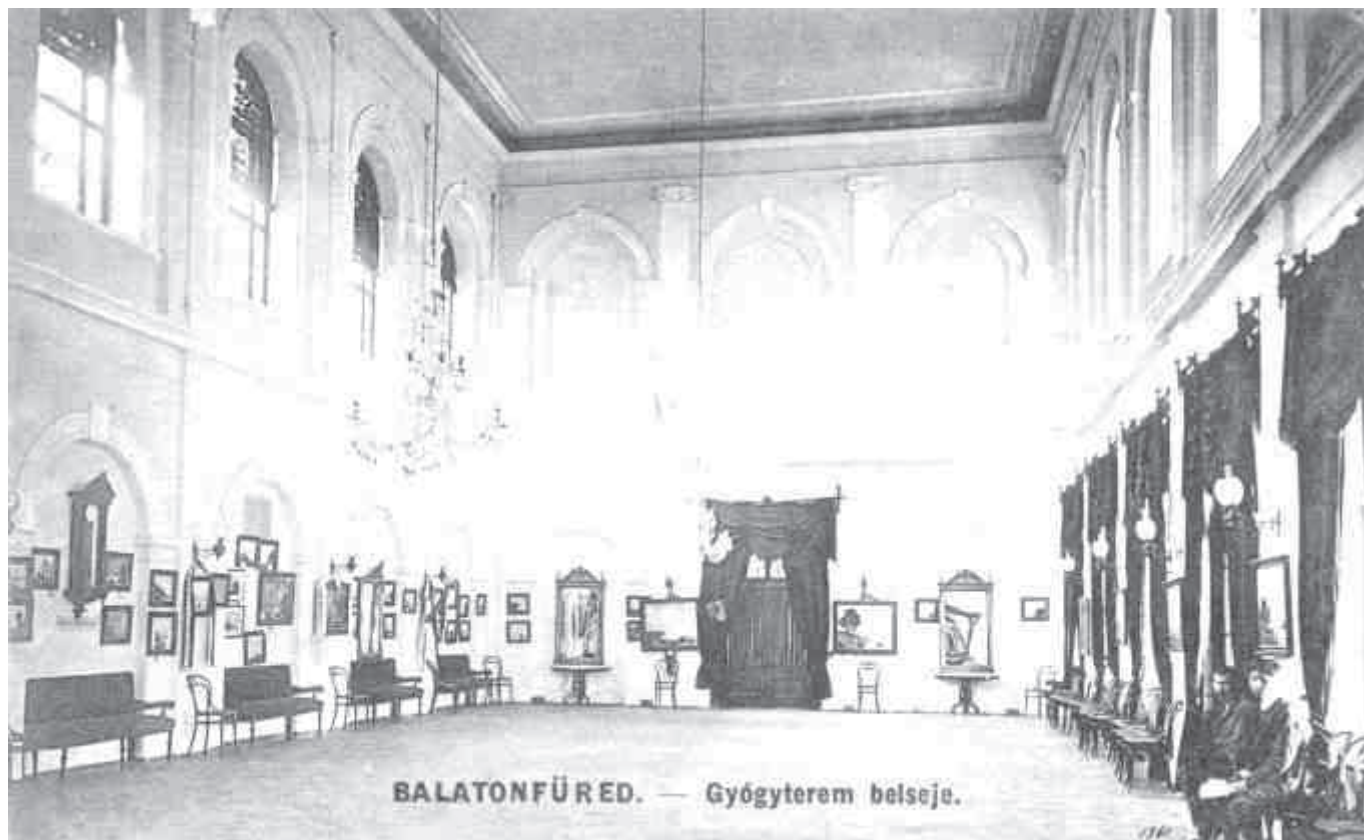
A gyógyterem 1909-ben