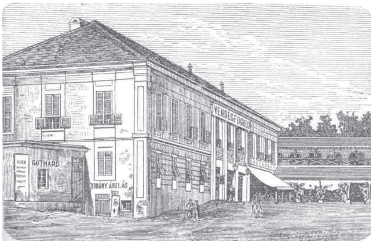
A vendégfogadó emeleti termében tartották 1848–1879 között az Anna-bálokat