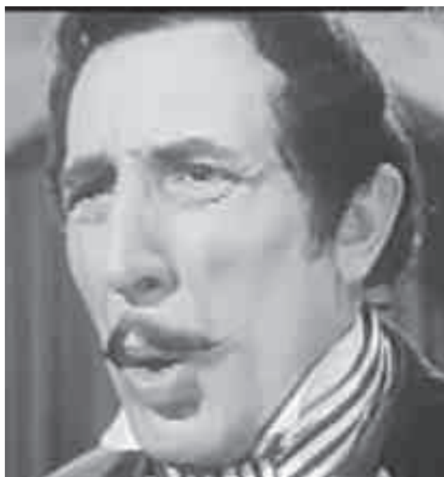
Balázs Samu (1906–1981)

„Ügyesen rajzolt alakok személyesítették meg a múlt század embertípusait: a külföldiekért rajongó magyar mágnást, a külföldieket majmoló szélhámos vénkisasszonyt, a maradi magyar urat, a szépségével és okosságával imponáló magyar nagyszasszonyt, a félreismert, de a külföldieket minden tekintetben felülmúló magyar úrilányt.”