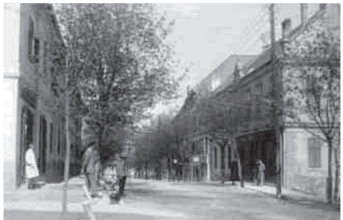
A patika előtt (1930)

A patika és az illatszertár között volt nagyszüleim lakása, gyermekkorom másik kedves színtere. A patikához tartozó kiszolgáló helyiségek, a laboratórium és az inspekciós szoba a Zsigmond utcai szárnyat foglalták el, a lakás pedig a Blaha Lujza utcai frontra nézett. A patika mellett a hálósoba, a vendégháló, a szalon, majd az illatszertár következett. Ezek mögött helyezkedett el az óriási ebédlő, közepén a hatalmas, bordó bársonnyal letakart ebéd-