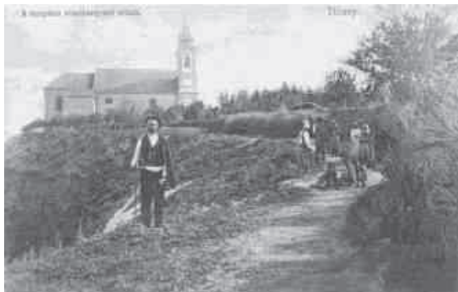
Tihanyi látkép 1900-ban

hogy az egyre gyorsabban kiépülő Füred-fürdőn sem nélkülözheték a munkáját. Már 1863. áprilisában a fürdőcsarnok építésének megkezdésekor jelzi Écsy: „Érkezett Sturm asztalos”. Szeptemberben bútorokat rendel tőle, amelyek néhány hét alatt el is készülnek. 1864 februárjában más, az előző évben megrendelt bútorokat éppen akkor szállítják Füredre, amikor jelen van a „főtisztelendő adminisztrátor úr” az apátság jószágkormányzója. Écsy elégedetten állapítja meg, hogy Sturm mester munkája „igen tetszett nékie”. Ugyanebben az évben Écsy fürdőmesterként is alkalmazza: fizetése négy hónapra 24 forint és 60 forintot kap élelmezésre. 9