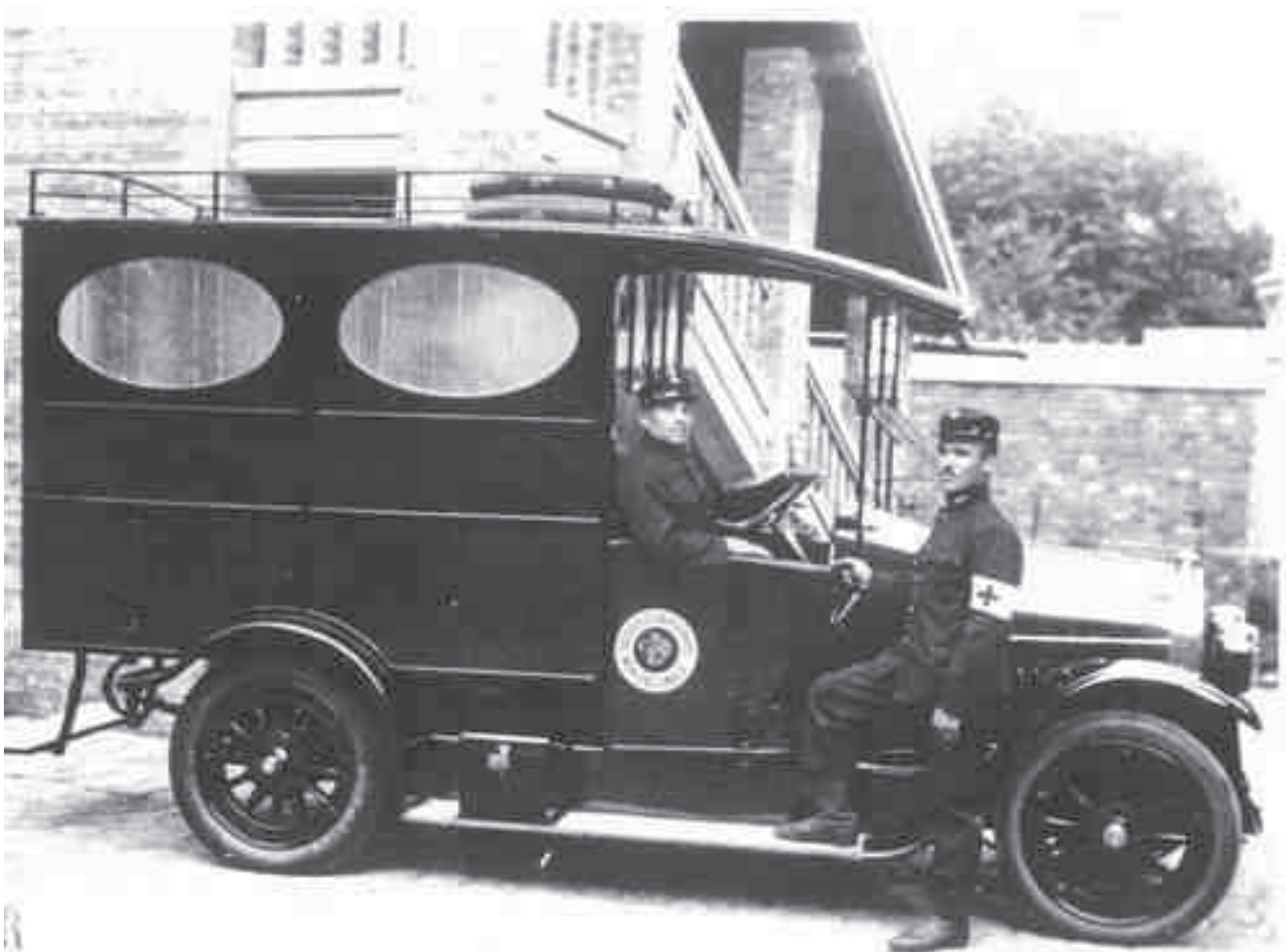
A mentőszolgálat „Magosix” gépjárműve az 1920-as években

utolsó dokumentuma) „mivel a Balatonból való mentésnek a kérdését mielőbb megoldásra szeret- nénk vinni és evégből a Balatoni Önkéntes Mentő- egyesületet, mint országos egyesületünk fiókját még e nyár folyamán életre hívni óhajtjuk. Ezen fiókegyesület keretében öt vízből mentő állomást óhajtunk fokozatosan felállítani – amelyek között bennfoglaltatik Balatonfüred vagy Tihany is, azon- ban amelyek közül a legelsőt Balatonbogláron óhajtjuk felállítani – és minthogy ezen vízből men- tő állomások szárazföldi működését is biztosíta- nunk kell, így Balatonfürednek közvetlenebb men- tőszolgálattal való ellátásával is foglalkozunk prog- ramunk kertén belül. Egyrészt arra kérjük Nagysá- godat, hogy addig, amíg más megoldást nem talá- lunk, a veszprémi mentőállomás szolgálatának igénybevételét szíveskedjék szükség estére elője- gyezni és erről járása községet is értesíteni. Más- részt arra is kérjük, hogy a balatoni önkéntes men- tőegyesület megalapításában bennünket hathatós támogatásában részesíteni, és az egyesület műkö- dését annak idején eredményes tevékenységével előmozdítani szíveskedjék.”