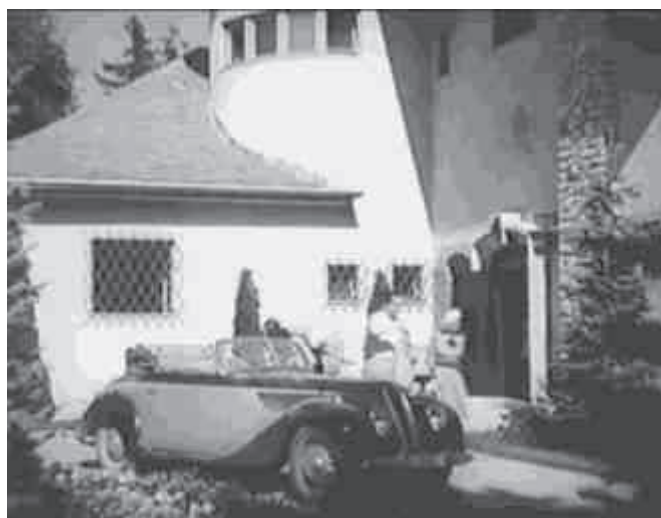
Az arácsi nyaraló bejárata (1943)