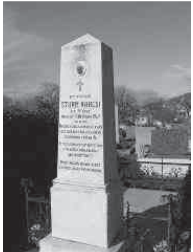
Károly síremléke az arácsi temetőben

szép arcú, sudár növésű fiúcska. Iskoláit Veszprémben végezte, a Katolikus Elemi Népiskolát „jó” osztályzattal, „dicséretes” erkölcsi magaviselettel és „kellő” szorgalommal. A középiskolát is Veszprémben járta ki, a Római Katolikus Főgimnáziumban, gyenge eredménnyel. Nem a tehetség vagy a kellő szorgalom hiányzott, hanem az egészség: gyakori betegeskedései miatt az is megtörtént, hogy az osztályvizsgát csak augusztus végén tehetete le. Betegségének, a félelmetes tuberkulózisnak gyors előrehaladását nem sikerült megállítani, tizenkilenc éves korában elhunyt. 16