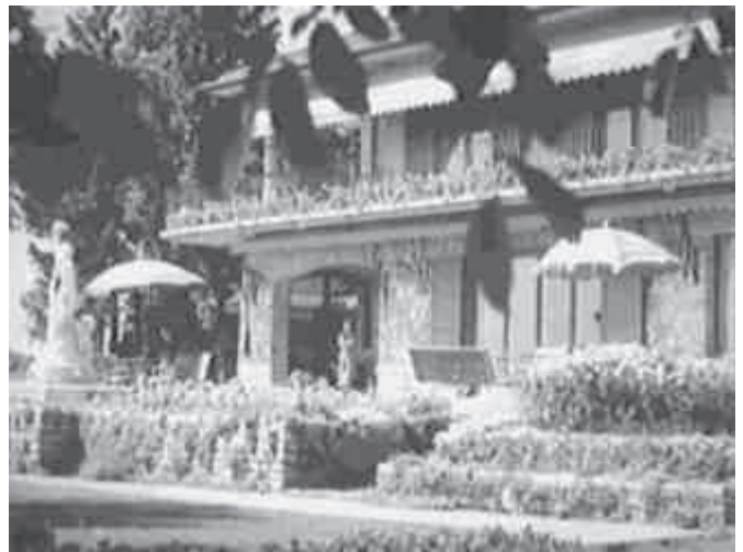
A nyaraló a Balaton felől (1943)

szönhető. A Tóth Lajos levelében említett „szenzációs dokumentumok” és Kossuth relikviák is nyomtalanul tűntek el.