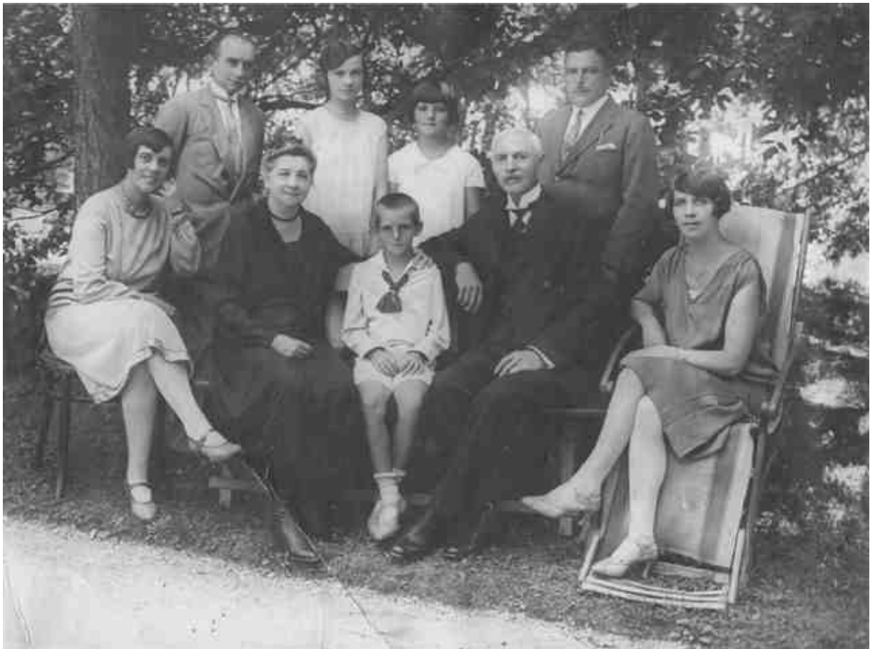
A Sturm–Tímár család