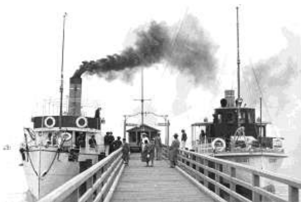
A füredi hajó kikötő az 1930-as években

1. Amikor 1941-ben megvettük a Mészöly u. 10. sz. alatti nyaralót, ez a terület közigazgatásilag Balatonarácshoz, üdülőhelyileg viszont Balatonfüred Fürdőtelepéhez tartozott. Az adót tehát Arácsnak kellett fizetni, de – mivel ott nem volt adóhivatal – a Csupakon lévő adóhivatalhoz kellett beküldeni. Az „üdülőhelyi díjat” Balatonfüredre az Üdülőtelep számára fizettük be. Irodájukat a sétány árkádos épületében, a baloldali szárnyban működtették. A postai címünk is ez volt: Balatonfüred-Fürdőtelep”