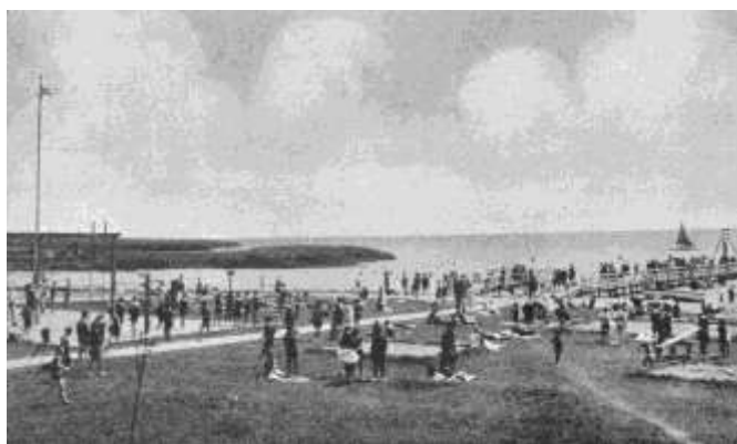
Füredi strandélet az 1930-as években

2. A kis sétány és nagy sétány között húzódtott Balatonfüred és Arács közigazgatási határa. Ha valaki az arácsi Esterházy strandról jött vagy oda ment, a nagy sétányon fürdőruhában nem mehetett végig, csak rendesen felöltözve, vagy legalább fürdőköpenyben, mert a fürdőtelepet a bencés rend birtokolta.