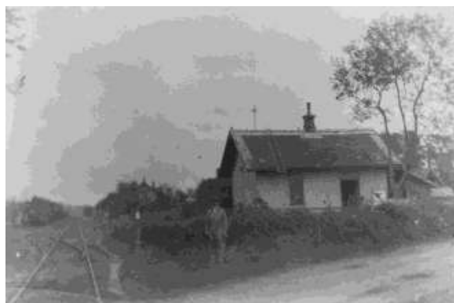
A balatonfüredi vasútállomásnál (1940-es évek)