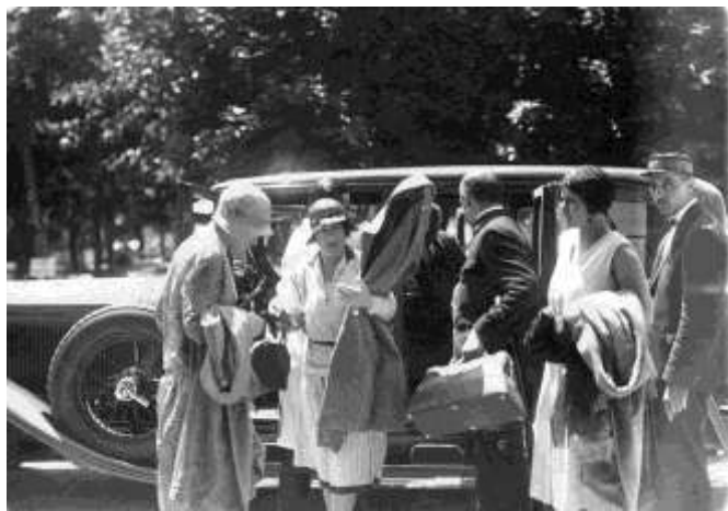
Vendégek érkeznek a szanatóriumba (1930-as évek)

nek az egyik lába béna volt, ő valóban fél lábbal úszta át a Balatont. A szerk.)