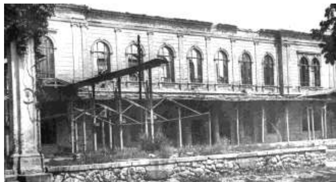
A kurszalón kiégett épülete

8. A háború után először 1946 nyarán bicikliztem le Füredre. A kis sétányról átmentem a nagy sétányra. Orosz tankok foglalták el a sétányt teljes szélességben, csak egy szögesdróttal szegélyezett keskeny ösvényen lehetett haladni. Ez még 1947 nyarán is így volt. A Gyógy-téren az üdülöhelyi szalon kiégve szomorkodott. A szanatórium mögötti Esterházy Szálloda és az Esterházy Strandfürdő is szovjet tulajdonban volt. A fürdőben magyar személyzet dolgozott, de a bevétel szovjet kézbe került. Ugyancsak a megszálló hadsereg birtokolta a kioszkot is, ami a fürdővendégek kedvelt uzsonnázó helye volt.