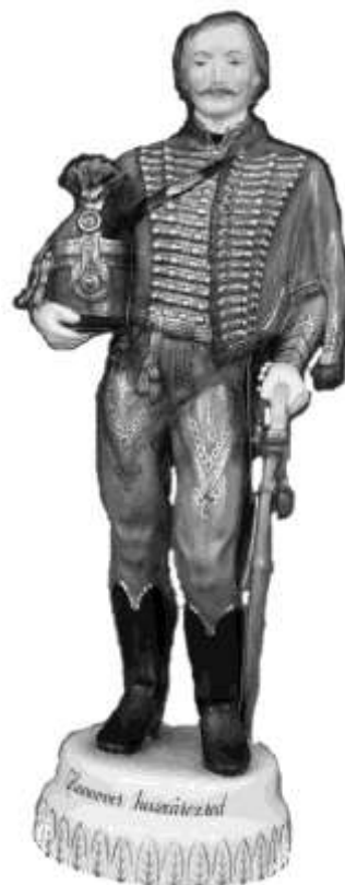
A Kiss Ernő-díj