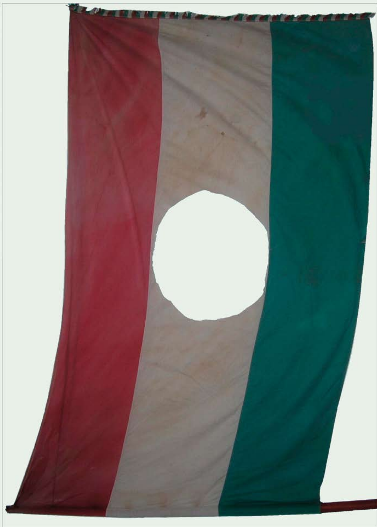
Az 1956-os füredi zászló (Városi Helytörténeti Gyűjtemény)