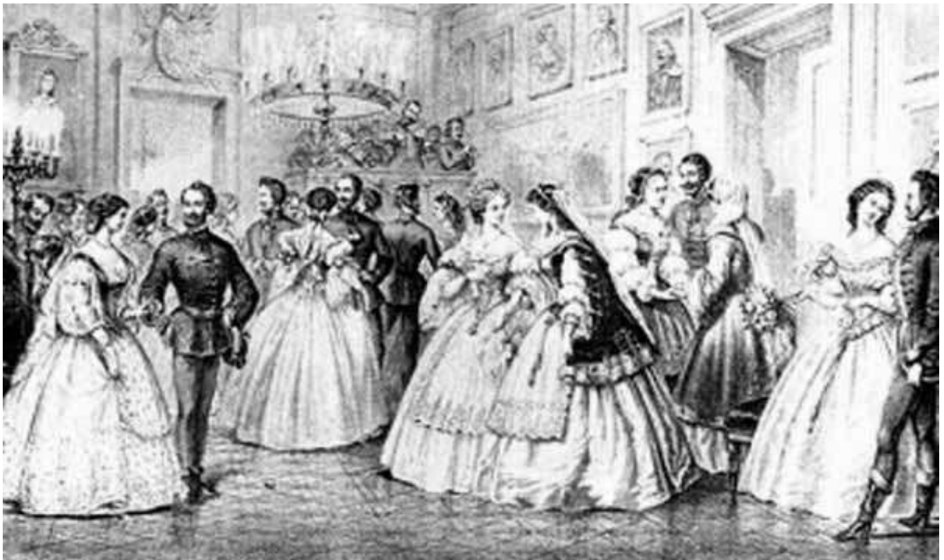
Báli jelenet a reformkorban