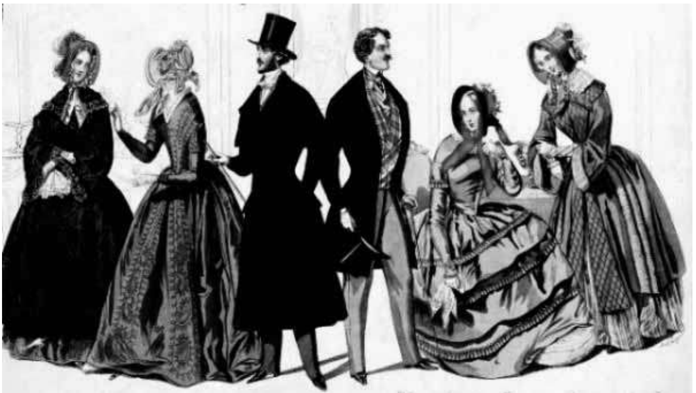
Reformkori női és férfi öltözékek

Az első bál nagy valószínűséggel nem a szentgyörgyi Horváth családhoz köthető, annak rendezése kezdetektől fogva az apátsági vendégfogadót bérlő és működtető vendéglősöknek köszönhető.