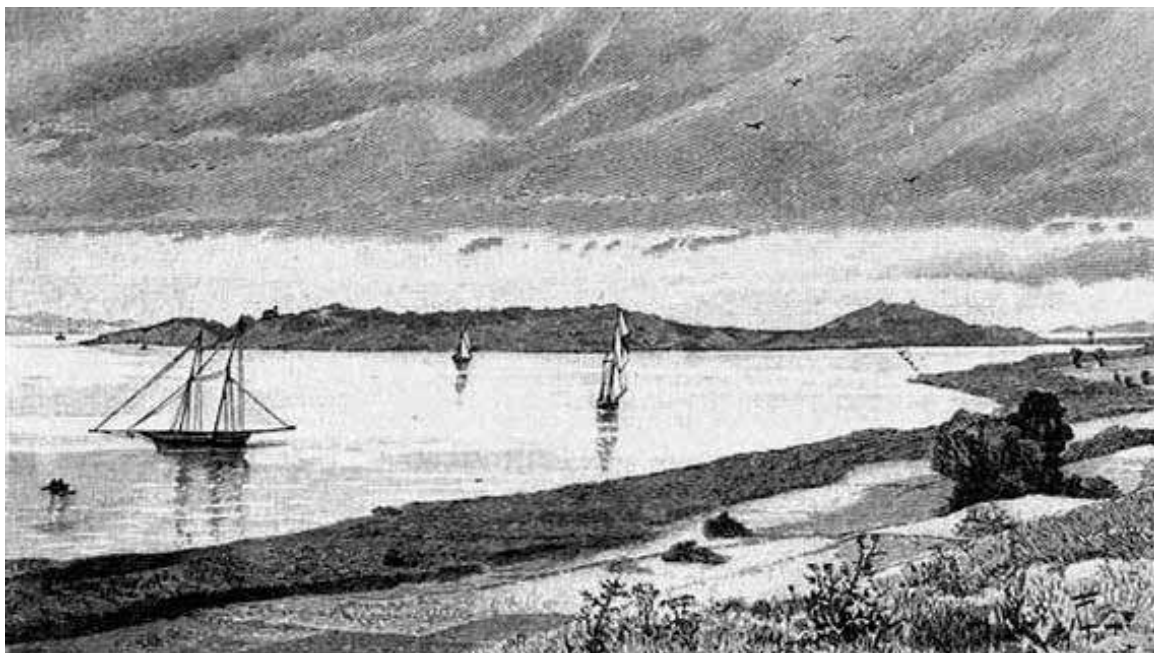
Füredi vitorlás életkép, háttérben a tihanyi félszigettel