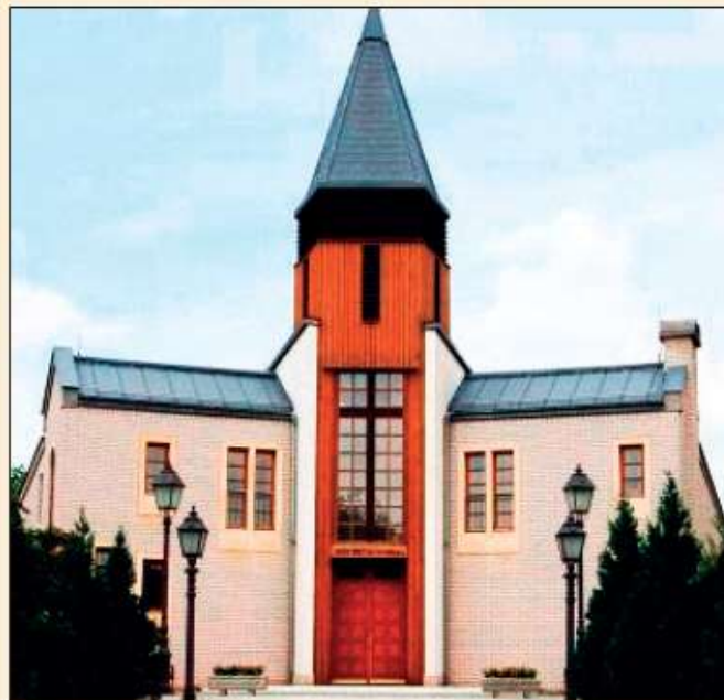
Füredi és arácsi templomok Balatonfüredi református (fehér); balatonarácsi református; balatonarácsi katolikus; balatonfüredi Kerek templom; balatonfüredi katolikus plébániatemplom; balatonfüredi evangélikus templom