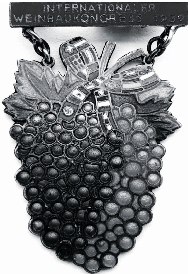
A kongresszusi küldöttek jelvénye (a szerző tulajdona)