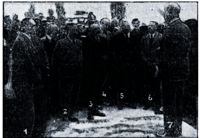
Balatonfüredi Borhét megnyitó ünnepe

a kormány biztosítson Németországba nagyobb szőlő- és borszállítási kvótákat. Nem is eredménytelenül, mert szeptember végére a magyar és a német kormány megállapodást kötött a Németországba történő szőlő- és gyümölcskivitel ügyében. Az összes szállítmányt egyetlen német cég, a Transdanubia vette át Hegyeshalomban. A német cégnek csak egy magyar partnere volt, a Gyümölcskiviteli Egyesülés. Az ő feladata volt továbbá a kontingensek elosztása a termelő területek között Magyarországon. Ez az új megállapodás lehetővé tette, hogy a magyar szőlőszállítmányokat ne érintsék Németország területén a háborús szállításból származó nehézségek, melyeket a vevő úgy kívánt elhárítani, hogy a magyar szállítmányokat Hegyeshalomtól kezdve zárt vonatok vitték az egyes német fogyasztópiacokra. Érdekességként megemlíthető, hogy Németország 1939-ben 1000 vagon magyar szőlőt tervezett megvásárolni.