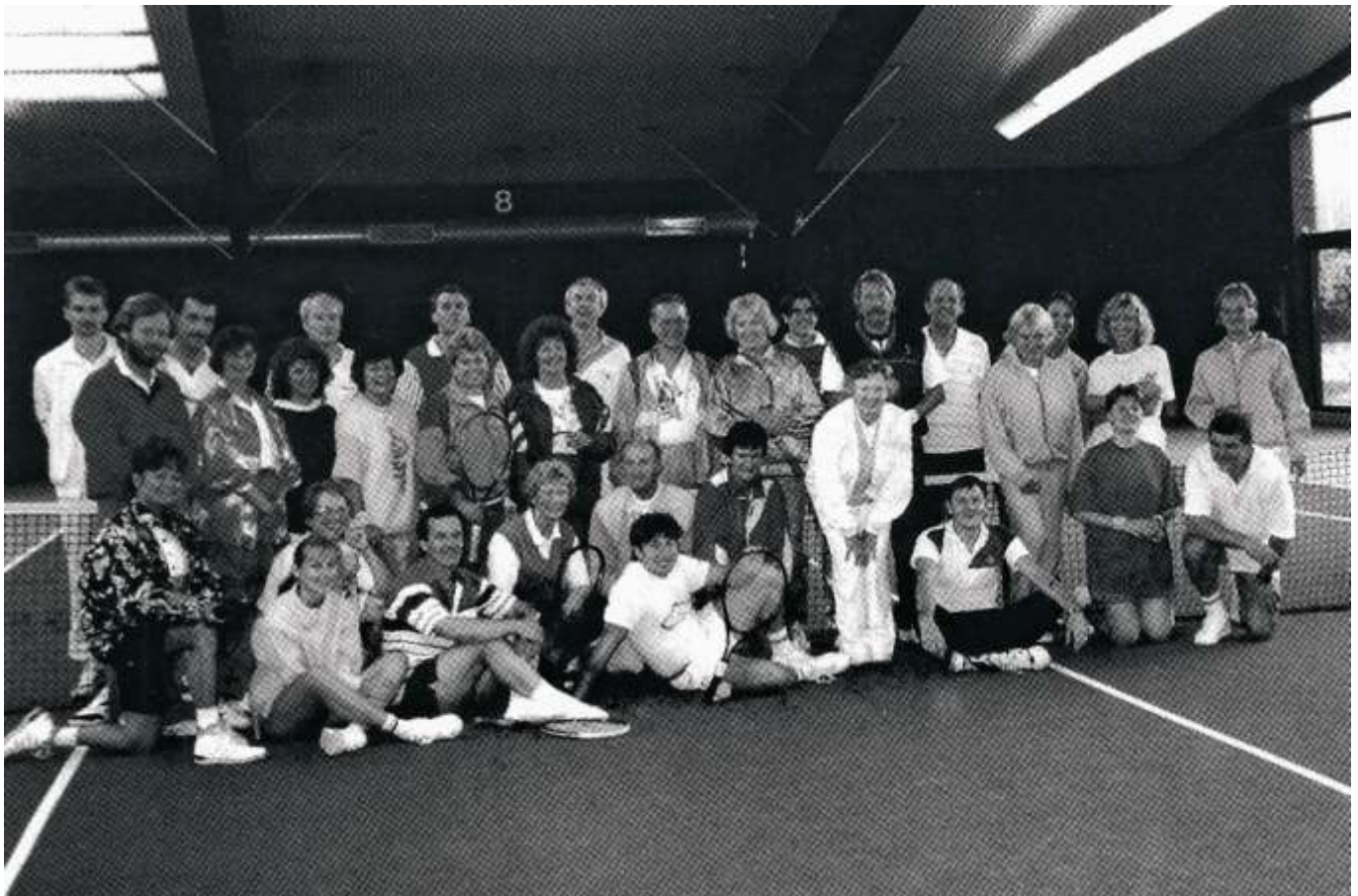
Germering-füredi teniszcsapat. Germering, 1995. szept. 1-4.