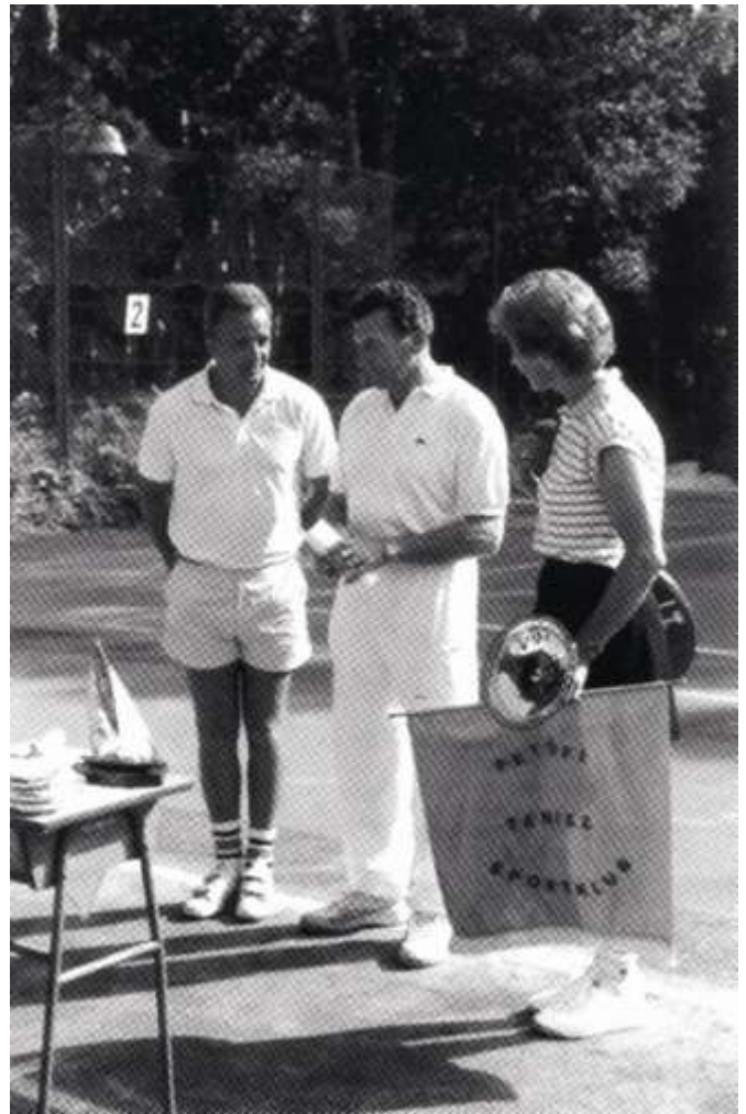
Balatonfüred, 1988. július 1–3.