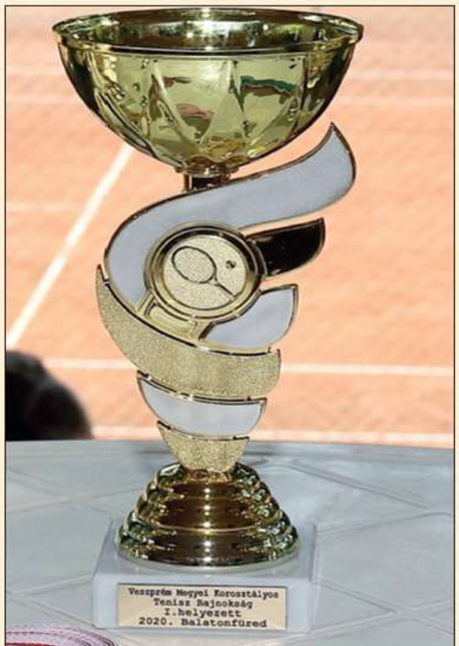
Veszprém Megyei Korosztályos Tennis Bajnokság 1. helyezett 2020. Balatonfüred