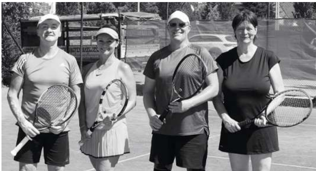
A 2020. évi balatonfüredi Szent István-napi tenisztorna indulóinak egyik csoportja.