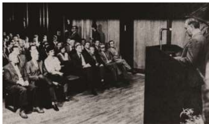
Az ünnepélyes avatás a nagyteremben (1981. november 11-én)