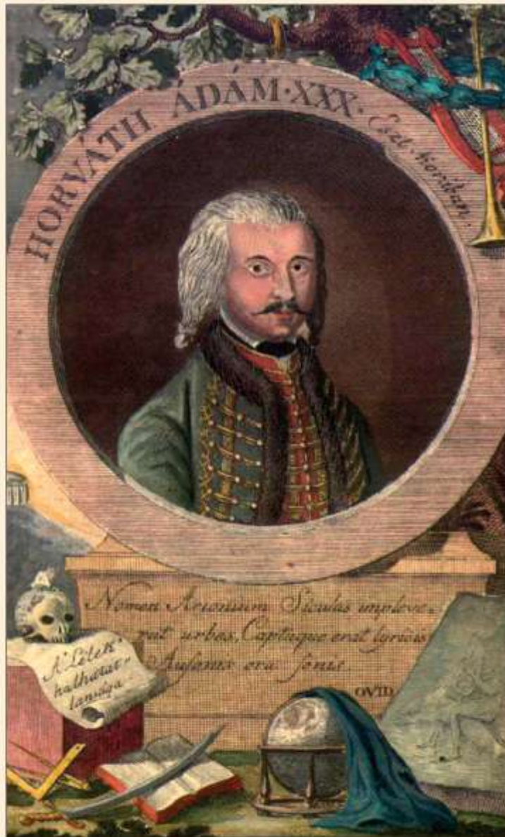
Pálóczi Horváth Ádám harminc éves korában

A kép forrása: http://www.esokonai-esurgo.sulinet.hu/sarkozy/kepek/33.jpg (– a link már nem él)