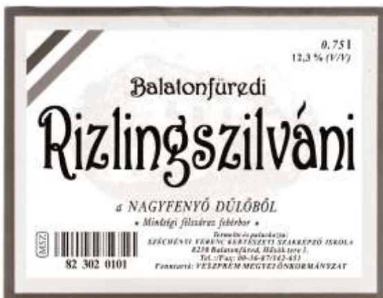
Borcímke az iskolából (a szerző tulajdona)

Dr. Bakonyi Károly több fajta klónszelekciójával is foglalkozott. A Rizlingszilváni fajta a 70-es években frissítésre szorult és az új klónban sikerült kiemelni jó tulajdonságokat. Nőtt a fürtök tömege, így a termésátlag is több mint 7%-al emelkedett. A K3 klón zamatosabb is lett az alapfajtánál. A Rizlingszilváni K3 klón 1992. május 20-án állami elismerést kapott.