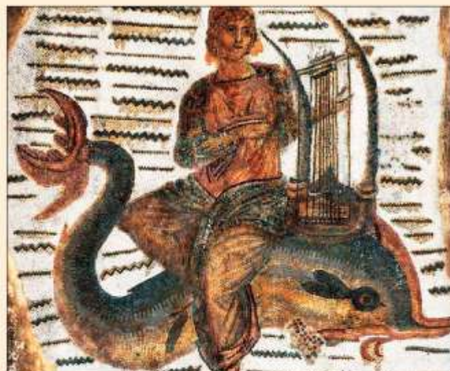
A delfinen lovagló Arion