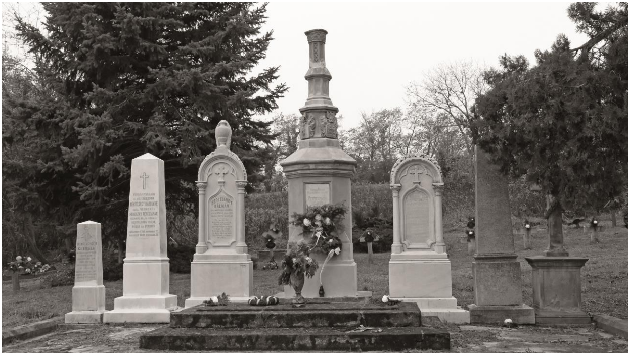
A Hertelendy-család síremléke a lesencetomaji temetőben