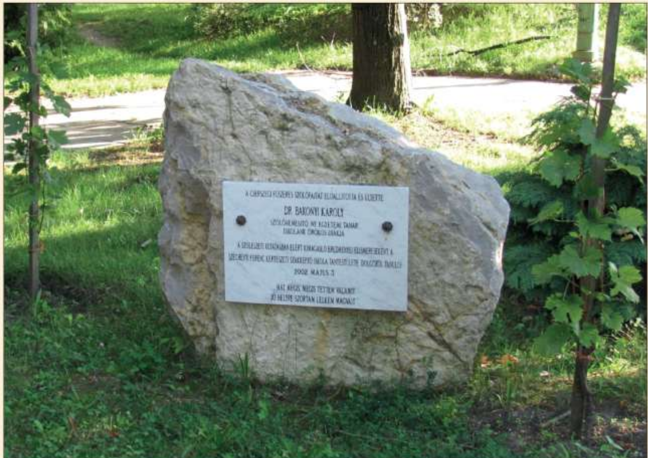
Dr. Bakonyi Károlyi emlékköve és emlékszlői a balatonarácsi szakiskola kertjében (Csizmazia Darab József felvétele, 2010. augusztus 21.)