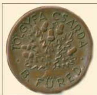
A Tölgyfa csárda bútorgomb díszítése