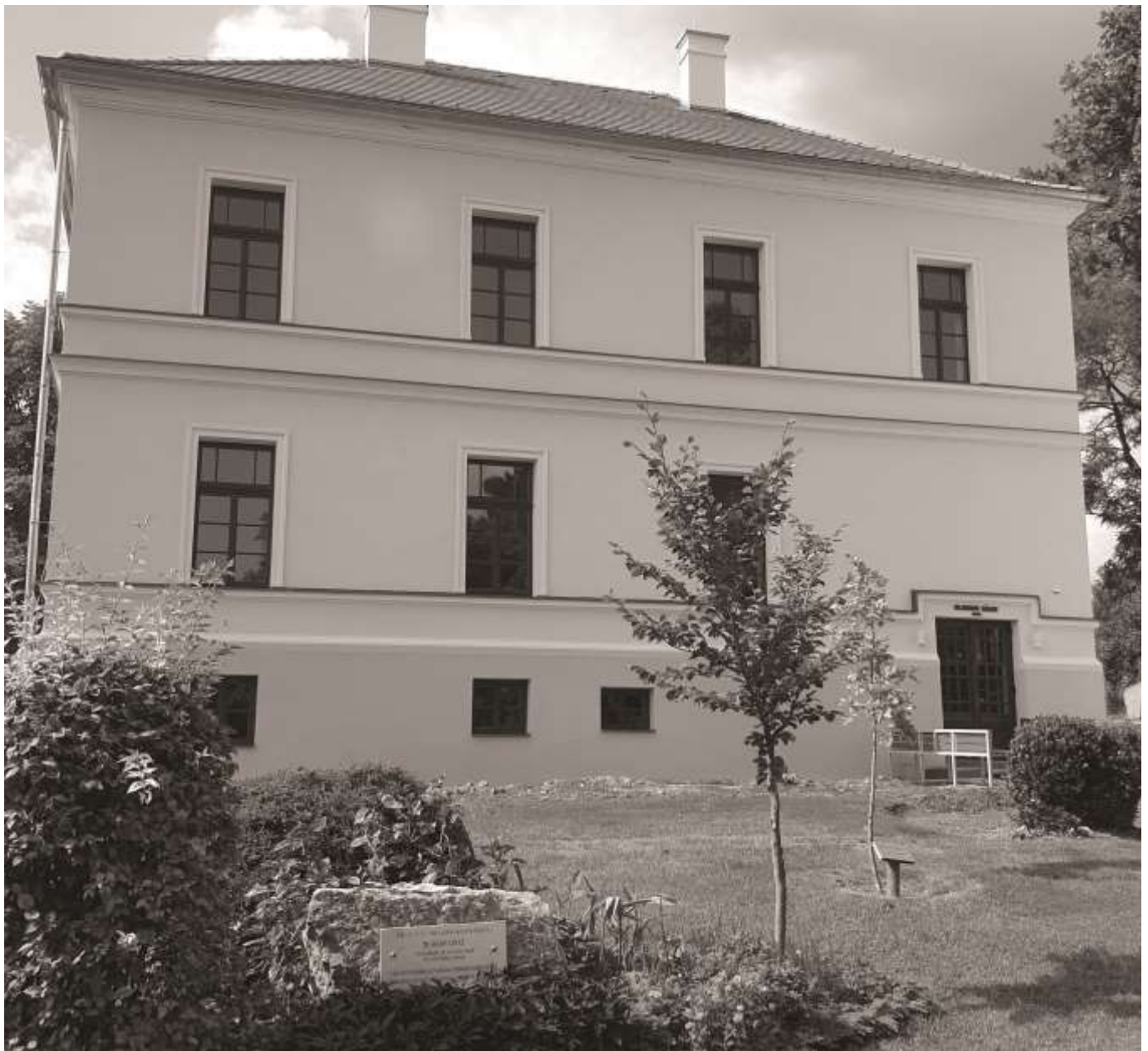
A frissen felújított „Dr. Bakonyi Károly épület” előtt az áthelyezett emlékkövel