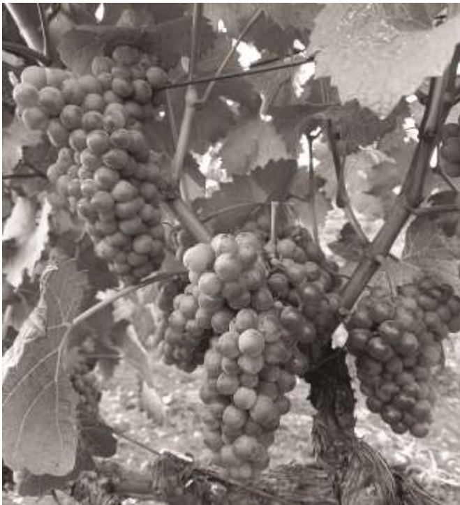
Rozália fajta a Koczor Borászatban 2021. augusztus végén

A Rozália 2002. január 29-én, 22 évvel a nemesítést követően kapta meg az állami elismerést. A fajtát a Koczor pincészet máig megőrizte választékában és bora ma is kóstolható.