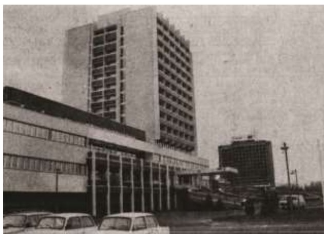
A balatonfüredi SZOT Oktatási Központ 1981-ben, a háttérben a Hotel Marina épülettömbje