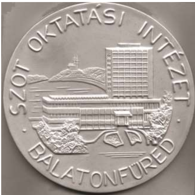
Emlékplakett a füredi Oktatási Központról (Városi Helytörténeti Gyűjtemény – Ivácskovics György ajándéka, 2021)

Az új intézetben az oktatási év során 24 tanfolyamon 3200 hallgatót képeztek: itt tartották az öthónapos munkástovábbképző tanfolyamokat, az szb-titkárok és a rezortfelelősök továbbképzését, számos előadást szerveztek a szakszervezeti bizalmiaknak. Csopakról ide telepítették át a szakszervezetek Veszprém megyei továbbképző iskoláját is. Az intézmény az év négy hónapjában az üdülést szolgálta.