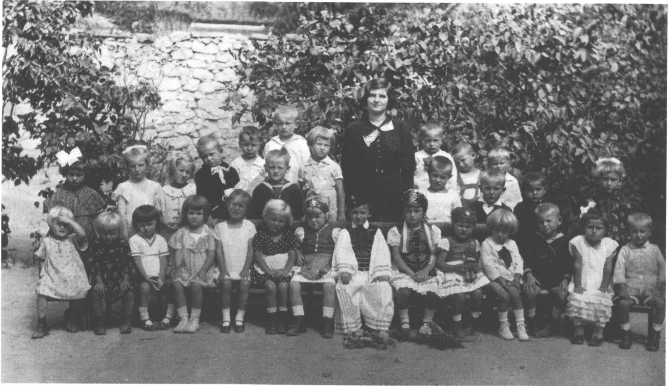
A katolikus óvoda 1928-ban nyílt meg a korábbi katolikus elemi iskola épületében.