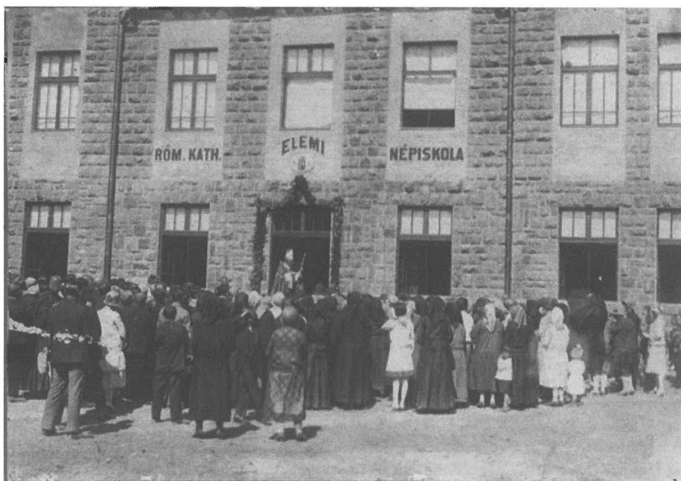
A piros iskola felszentelése, a bejáratnál Rott Nándor püspök áll

Az iskolát egy évvel előbb, 1928 szeptember 8-án szentelte fel Rott Nándor veszprémi püspök.