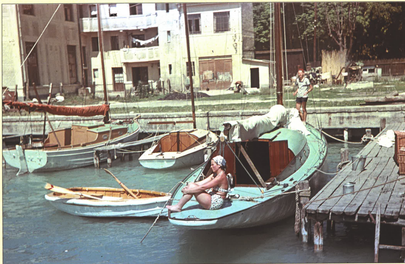
A balatonfüredi vitorlás kikötő 1950-ben