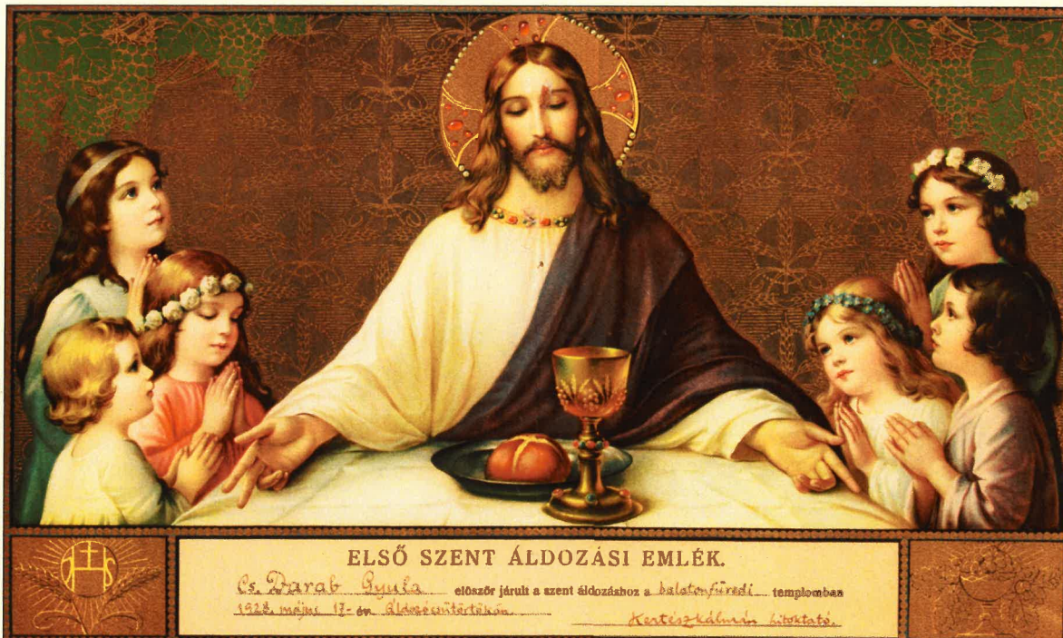
Cs. Darab Gyula első áldozási emléklapja az egy évvel korábban átadott füredi Piros templomban