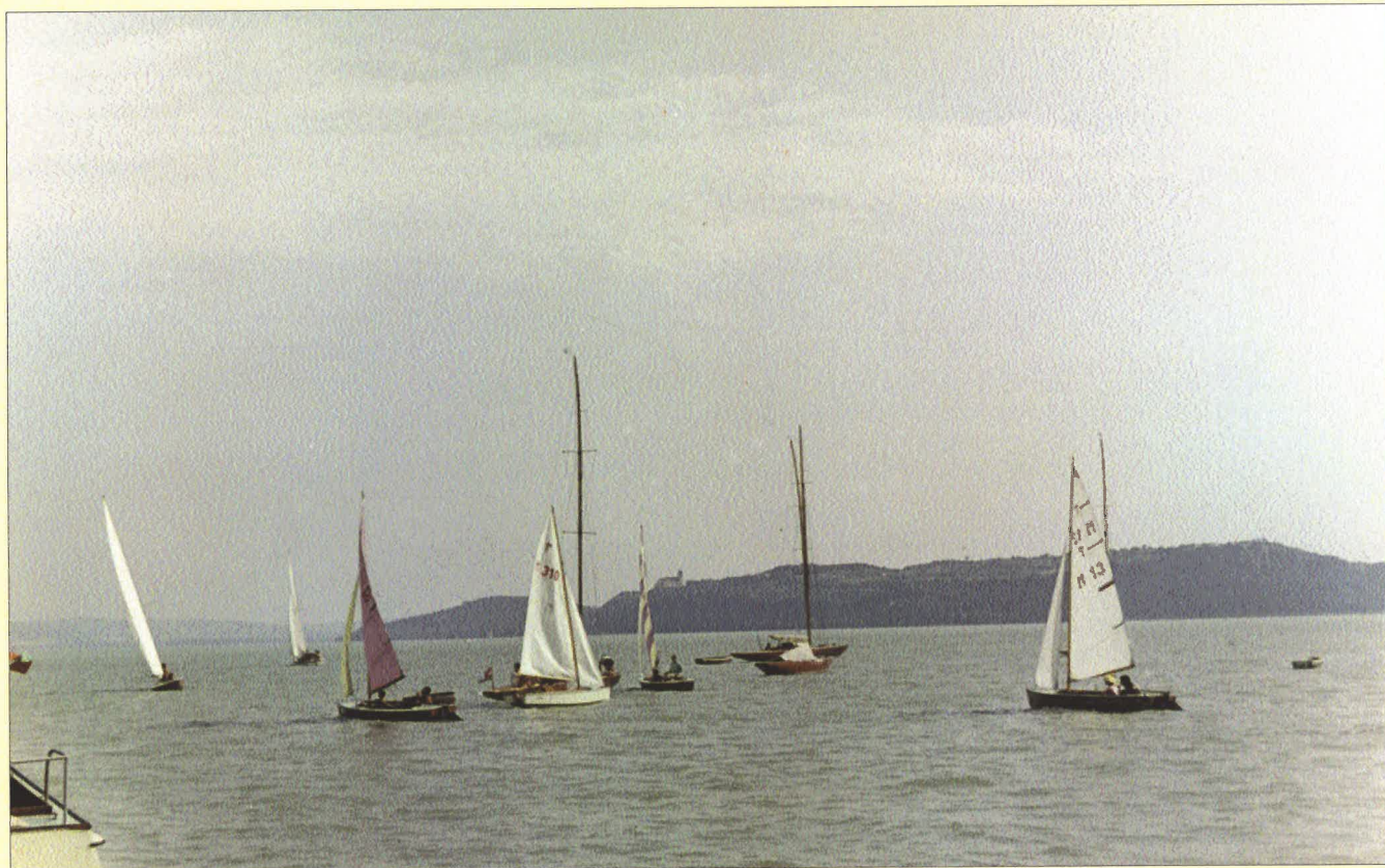
Vitorlások Balatonfüred előtt 1958-ban

Letöltés ideje: 2024.február 10., 10 óra 35 perc