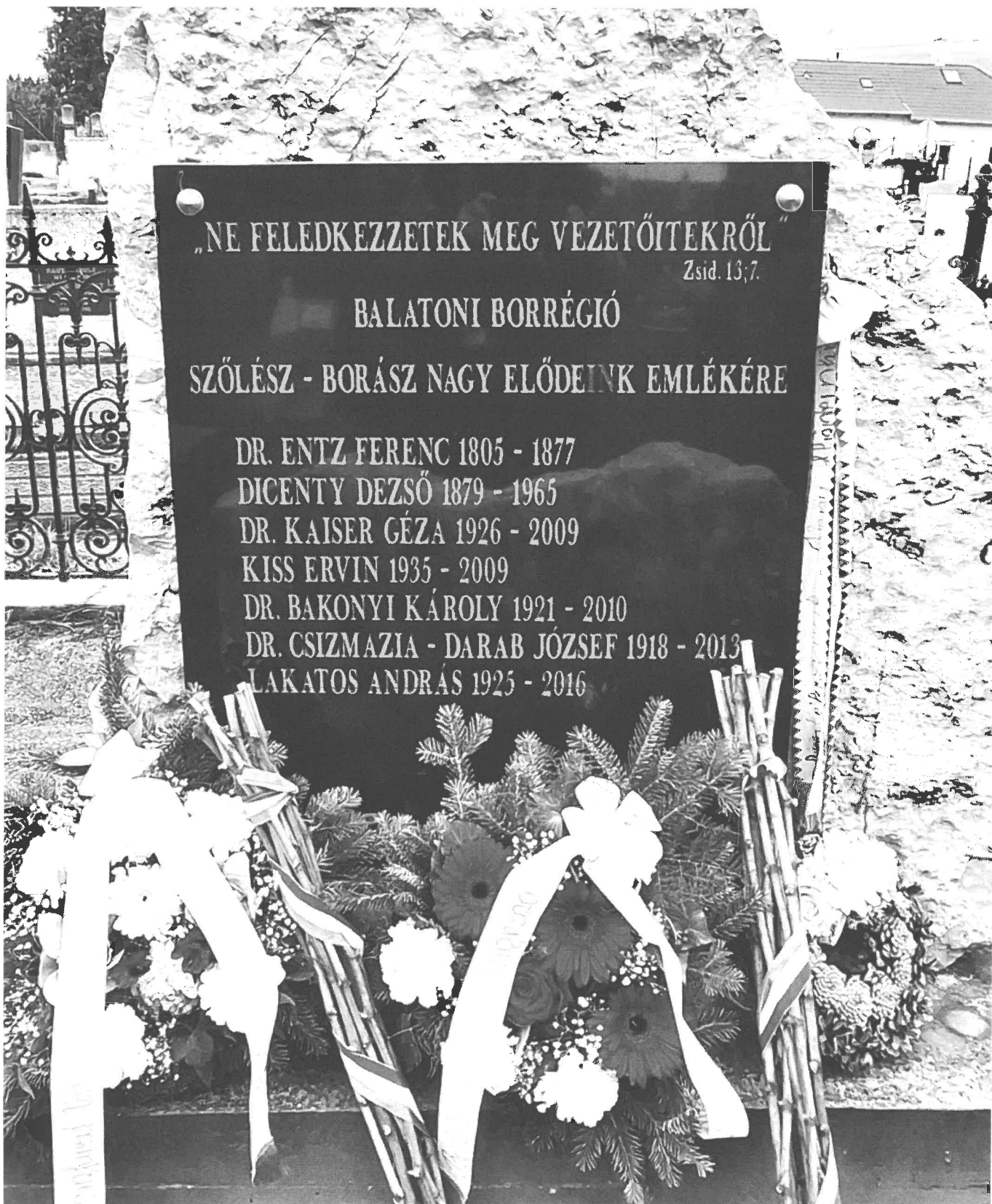
A nagy borász elődök táblája Balatonfüreden a református temetőben, a 2025. március 29-i megemlékezésen