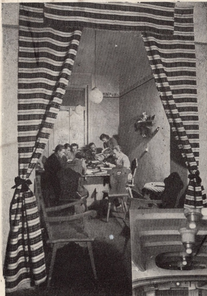
A soroksári Szabó Ervin ke- rületi könyvtár olvasóterme