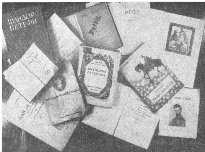
Részlet az Országos Széchenyi Könyvtár Petőfi-vándorkiállításáról