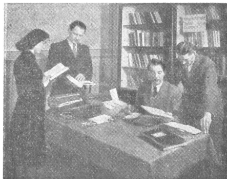
A Rákosi Művek üzemi könyvtára

A kölcsönzéshez 150—200 olvasóig célszerű füzetes rendszert alkalmazni, melyhez a központi könyvtáros a füzetet előre megvonalazza. Egy-egy lapot egy-egy olvasónak tartunk fenn. A lap felső részén