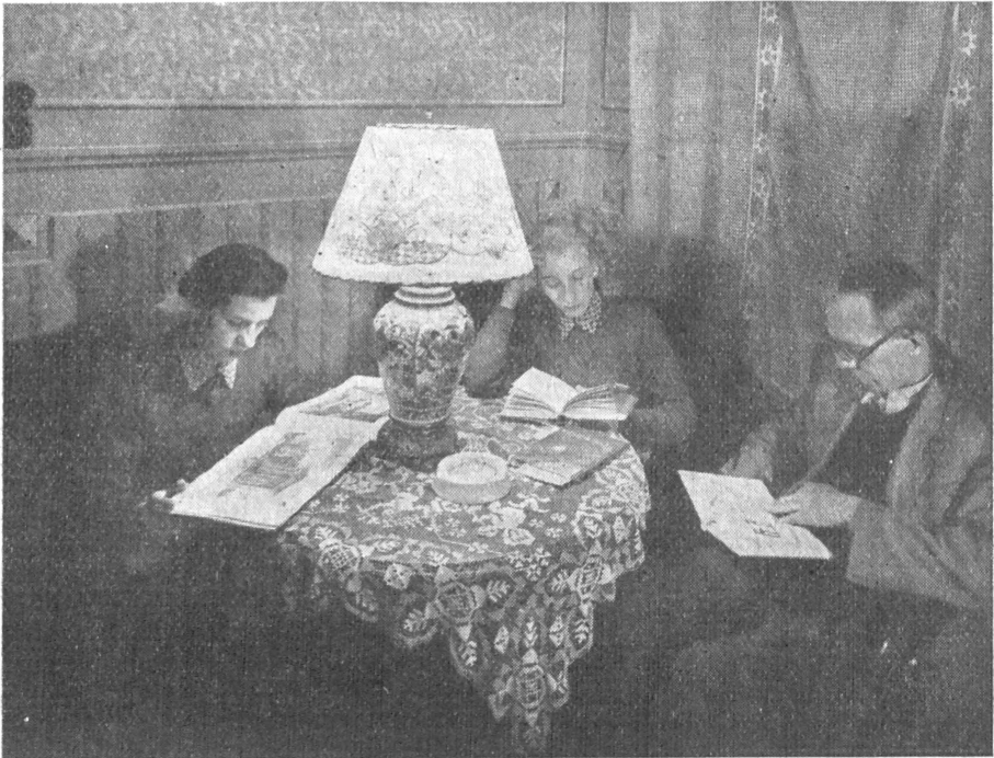
A Rákosi Művek könyvtárának olvasóterme

Zola: Igazság, Majakovszkij elbeszélő költeményei, Mulik Radzs Anand: A kuli, Mikszáth Kálmán: Beszterce ostroma — Új Zrinyiász, Groszman: Sztjepan Kolcsugin, A. Tolsztoj: Emigránsok, Sztálin: A leninizmus kérdései, Klasszikus lengyel elbeszélők, Podjacsev: Gyötrődés, József Attila Válogatott Művei.