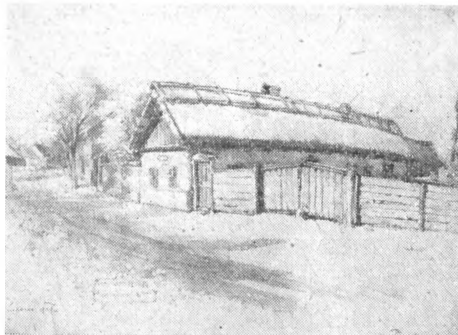
Petőfi szülőháza Kiskőrösön

Az ünnepi hét a hagyományos szokáshoz híven Szilveszter éjszakaiban kezdődött, amikor is Kiskőrös lakossága Petőfi születésének órájában fátylasmenetben vonult a költő szülőházához és megkoszorúzta azt. A ma emlékműzeumnak berendezett kis nádfedeles házacská az egész héten ünnepi fényben állott, s a lakosság, valamint a Kiskőrösön megforduló idegenek nagy számban keresték fel az alacsony gerendás szobát, melyben a legnagyobb lírikusunk meglátta a nap-