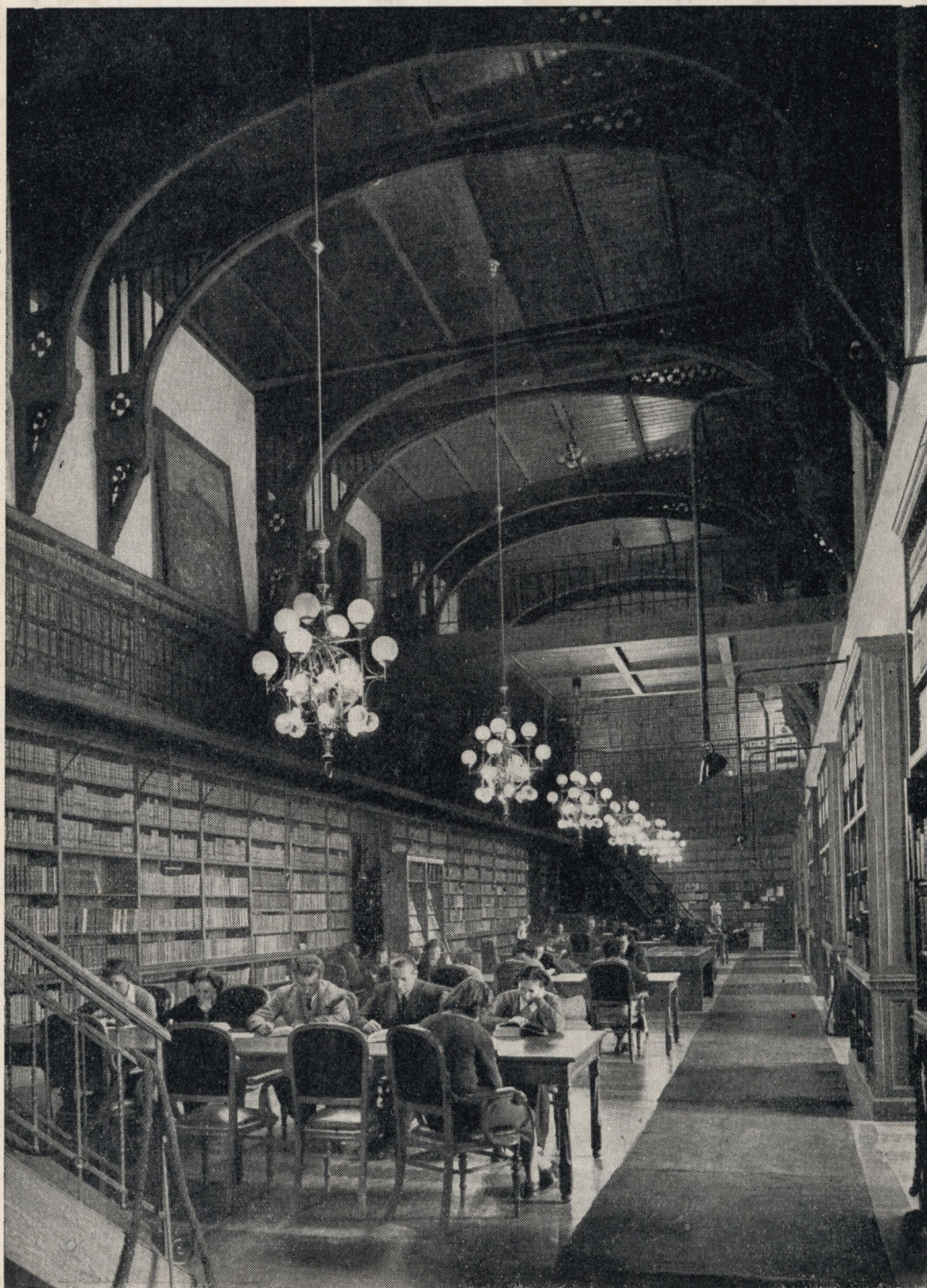
Az Országgyűlési Könyvtár olvasóterme (V., Kossuth Lajos-tér 1—3. XXV. kapu).

Nyitva: naponta 1/2 9—este 9-ig, szombaton 1/2 9—d. u. 2-ig