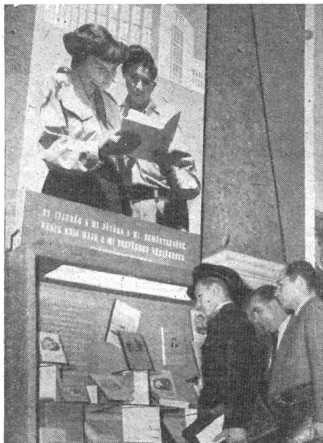
Az Ifjúsági Könyvkiadó vitrinje „A magyar könyv” kiállításon

A tudományos könyvkiadás másik szövetnehordozója az Akadémiai Könyvkiadó, mert amióta a Magyar Tudományos Akadémia a szocializmus szellemében megújodott, az akadémiai könyvkiadás tekintetében is nagy a változás és a fejlődés. Míg a múltban ugyanis, 1930-tól 1945-ig 159 könyvet adott ki a Tudományos Akadémia, addig az Akadémiai Könyvkiadó 1950 augusztustól 1952-ig 356 haladószellemű munka kiadásával gazdagította tudományos irodalmunkat. A kiállított művek