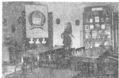
A Vas Megyei Könyvtár kiállításának részlete