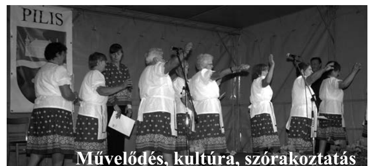
Művelődés, kultúra, szórakoztatás