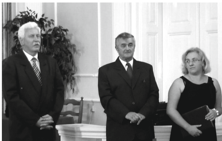
A „Balázs Tanár Úr és Fia” című képzőművészeti kiállítás megnyitója