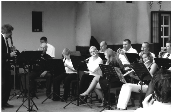
A Pilisi Zenészegylet nyitókoncertje