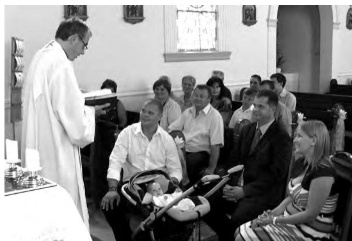
Keresztelés előtti pillanatok

„Nagyon nehéz az arany középutat megtalálni magunk számára is, családjunk, gyermekeink számára is. Biztos, hogy nem jó, ha valaki éhezik és nyomorog és tényleg sovány, de ugyanolyan veszélyes az is, ha halálra eszi magát. Az anyagi dolgokkal való viszonyban az arany középuton kellene járni, hiszen minden, ami van körülöttünk, Isten ajándéka, de ezek mind csak eszközök, és nem célok.”