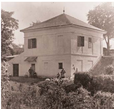
A dolinai ház 1923-ban

Dolinában, ahol a háza kertjében (amelyet a második világháború után teljesen leromboltak) az általa ültetett ikerfenyő még megtalálható és a domb oldalában lévő teraszok is, amelynek ötletét Kínából hozta, és amelyről számos cikkében megemlékezett.