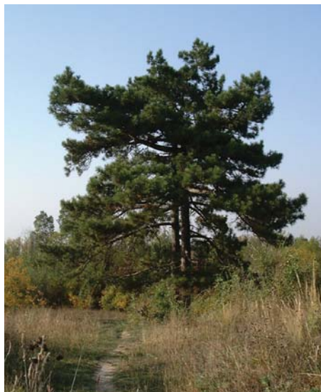
Pilis egyik jelképe a Gubányi Károly által ültetett ikerfenyő

Pilisen mintagazdaságot létesített. Ennek maradványai még ma is láthatóak a