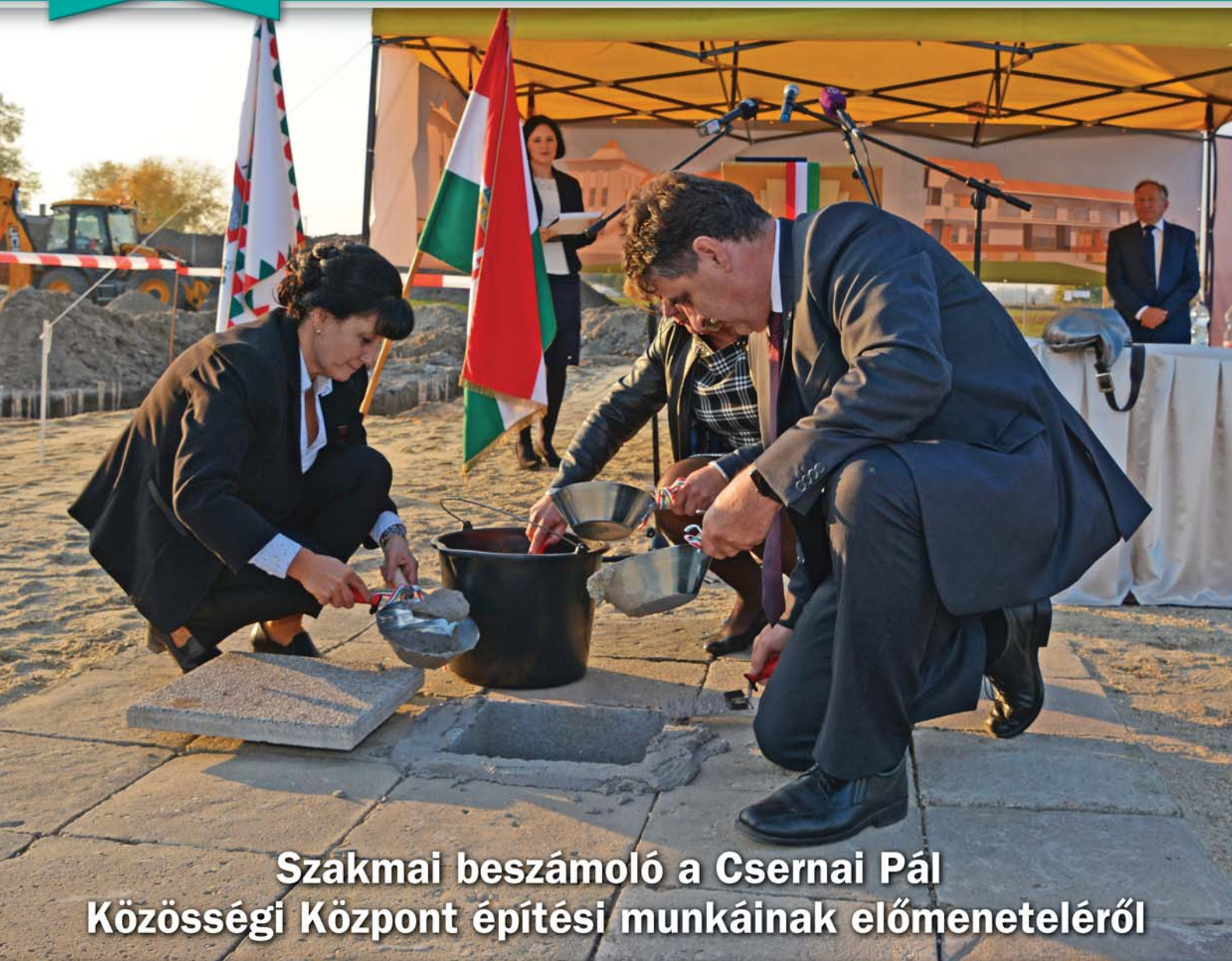
Szakmai beszámoló a Csernai Pál Közösségi Központ építési munkáinak előmeneteléről

PILIS VÁROS ÖNKORMÁNYZATÁNAK HIVATALOS LAPJA