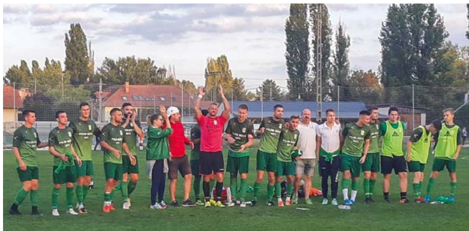
A csapat megköszöni a nézőknek a buzdítást a Szentendre elleni 6-0-ra megnyert meccsen.