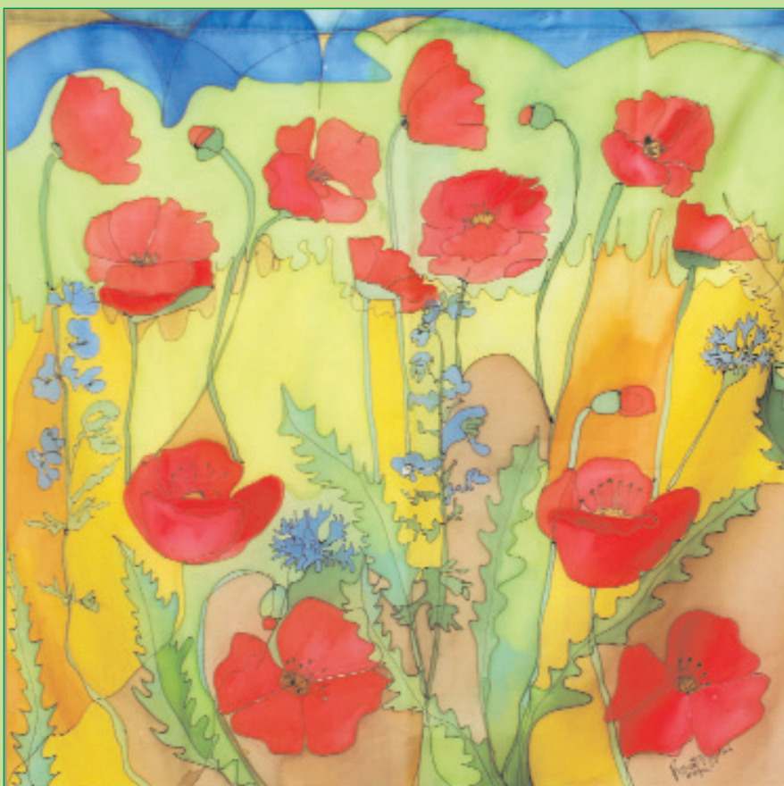
Teveliné Rezsőfi Gyöngyi selyemfestő munkáiból látható kiállítás március 5-ig a községháza nagytermében