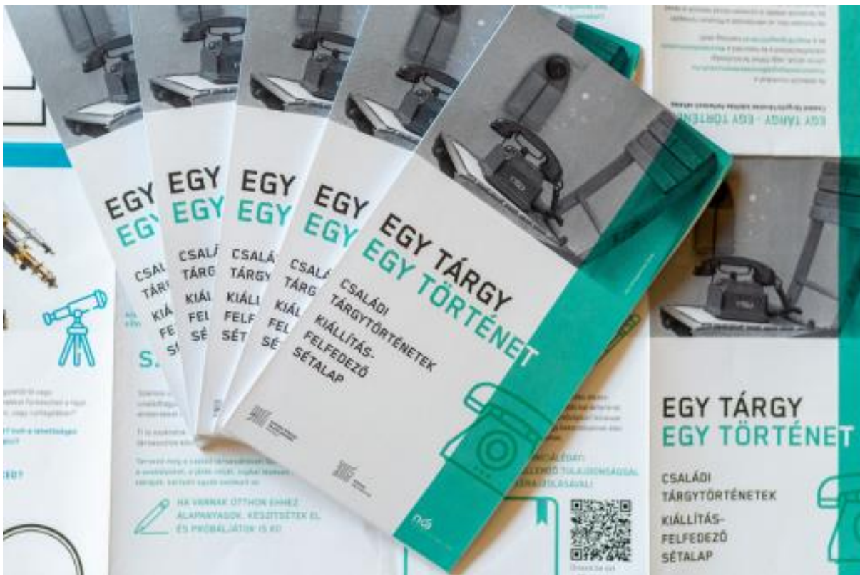
Egy tárgy egy történet kiállítás-felfedező sétalap

A családok a programon különböző eszközök (táskaírógép, 3D-toll) segítségével írták le, illetve alkották meg kedvenc régi vagy elképzelt jövőbeli műszaki tárgyaikat, azok használatát, tulajdonságait, funkcióit. Továbbá arra kértük őket, hogy jelöljék meg és rajzolják le számunkra a gyűjtemény legizgalmasabb tárgyait, amelyek rákerültek a térképre egyfajta informális népszerűségi kutatás eredményeképpen. Ebből a gyűjtésből született meg az Egy tárgy egy történet – Családi tárgytörténetek kiállításfelfedező sétalapunk, amiben a kiállítás térképe mellett a gyerekek egy-egy tárgyról készített rajza szerepel, sok izgalmas információval, továbbá nekik/hozzájuk szóló kutatást, megfigyelést és alkotást igénylő feladattal.