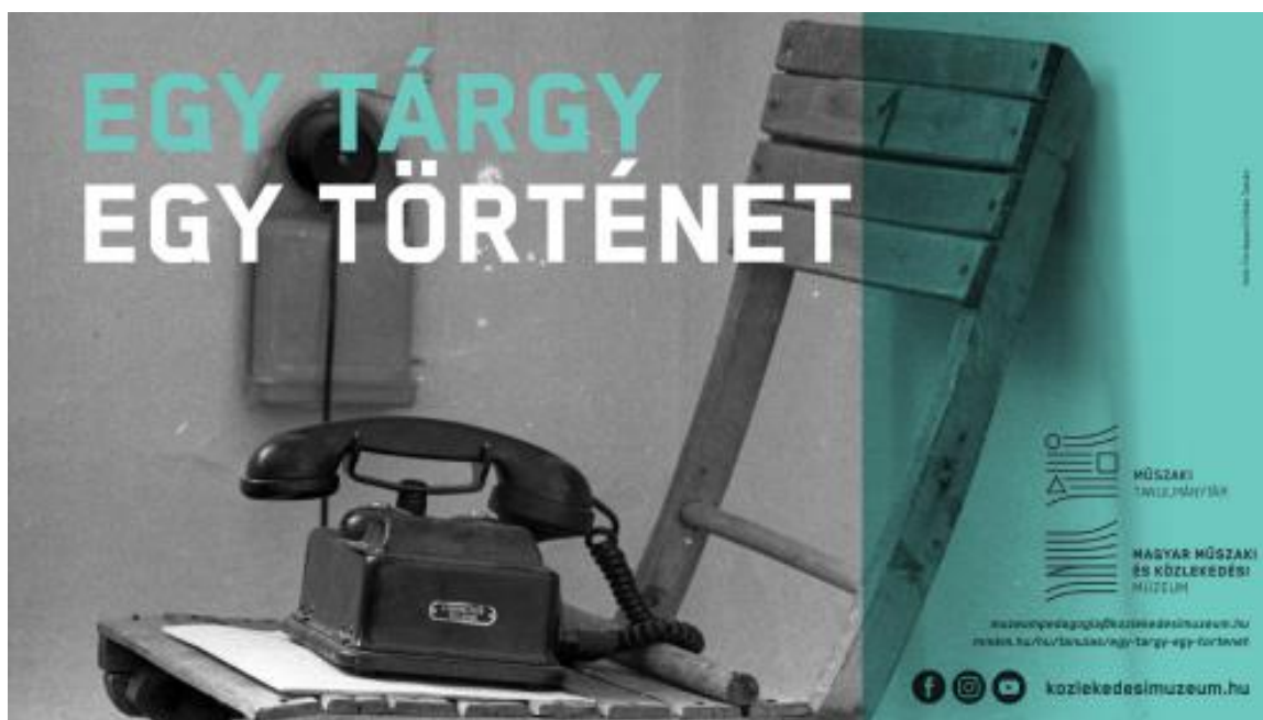
Az Egy tárgy egy történet felhívás plakátja

https://kozlekedesimuzeum.hu//hu/tanulas/egy-targy-egy-tortenet/egy-targy-egy-tortenet-beerkezett-alkotasok