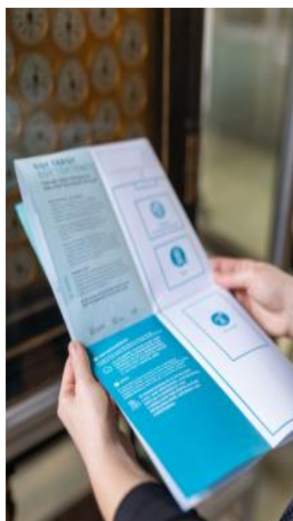
A Műszaki Tanulmánytár kiállításában elhelyezett információs táblák és felfedező sétalap

A családi napon a múzeumban berendeztünk egy kényelmes, az 1970-es évek korszakát idéző szobabelsőt is, ahová a gyerekek (és szüleik, nagyszüleik, testvéreik) leülhettek és elmesélhették családjuk egy-egy kedves, különleges műszaki tárgyának történetét. A felvételek készítése során számos demonstrációs eszközt választhattak (például mozsár, kuglófsütő, hordozható rádió, Rubik-kocka, diavetítő, szemüveg, fényképezőgép), amelyek inspirációs eszközként hatottak a mesélőkre és a mesékre egyaránt.