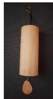
13. kép. Koshi szélharang

Relaxációhoz mindenképpen relaxációs zenét tervezünk. Az évszakokhoz kapcsolódóan számos relaxációs zene érhető el az interneten, de akár hangszereket is alkalmazhatunk a relaxációhoz. A Koshi szélcsengő például megfelelő hangszer lehet, hangja segíti az ellazulást, a nyugalmi helyzet elérését. Alkalmazása nem igényel speciális hangszertudást, a zsinórnál tartva finom mozgítás esetén is harmonikus hangzást érhetünk el a hangszerrel.