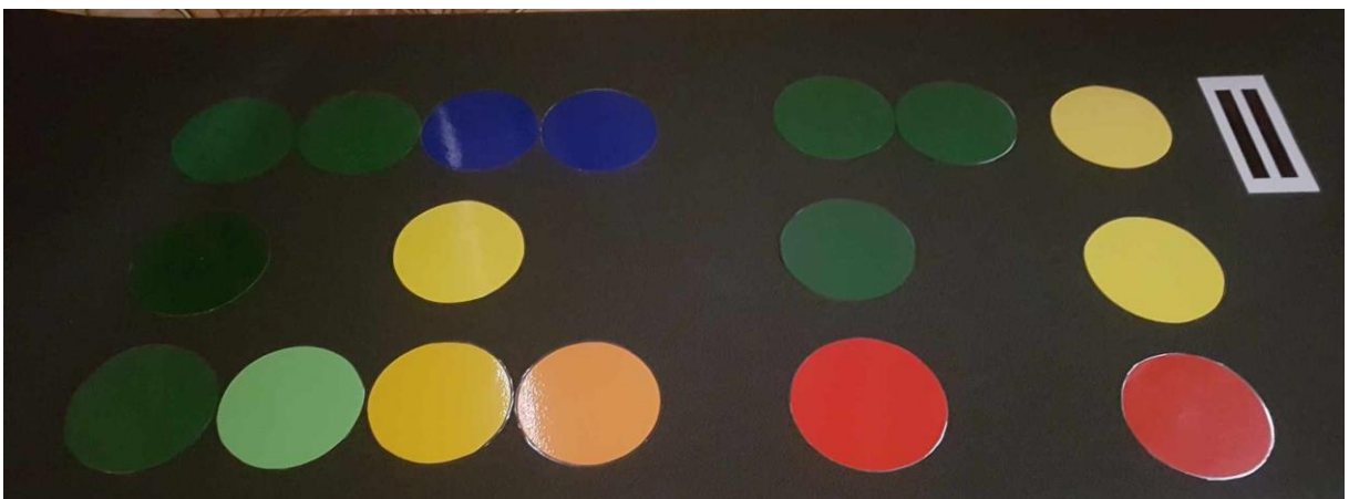
9. kép: A „Süssünk...” (ÉZÓ 180.) kezdetű dal (Forrai 2016) átírása színes kottára, boomwhackers, soundbells, handchimes alkalmazásához (C-dúr)

Amennyiben először alkalmazzuk a színes hangszereket, a színes kottát egy óvodai csoportban, érdemes előkészítő játékot tervezni a megértés segítésére, támogatására. Harang, hangcső, hangfújó alkalmazásakor egyszerűen ellenőrizhetjük a megértést, emellett tudatosíthatjuk is a gyermekekben, hogy a kezükben lévő hangszert csak akkor szólaltassák meg, amikor a színes kottában is az adott színt mutatjuk. Nagy létszámú csoport esetében alkalmazhatunk több hangszerkészletet is, vagy a csoportot két részre bontva is gyakorolhatjuk a színes hangszerek, a színes kotta alkalmazását azáltal, hogy a csoport egyik fele az egyenletes lüktetést érzékelteti (mozgással/ritmushangszerrel), a csoport másik fele pedig az adott színes hangszert szólaltatja meg a színes kotta segítségével.