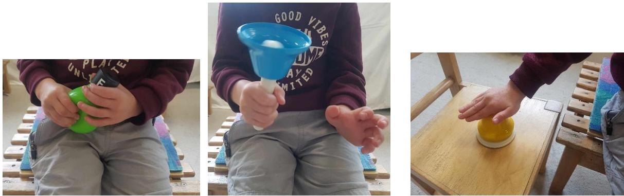
10-12. kép: A hangfújó, a nyeles és a kézi nyomógombos harang gyakorlati alkalmazása 1