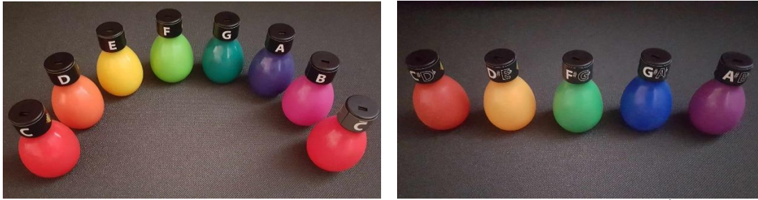
5-6. kép. Soundbellows (diatonikus és kromatikus készlet) (Fotó: Miliesz Ágnes Dóra)

A Handchimes egyelőre hangszeres előadásnál alkalmazható, a súlya miatt nehezebb megszólaltatni az óvodáskorú CP-s gyermekeknek. A harangok hangja kellemes, hosszabb-rövidebb hangok bemutatására is alkalmas.