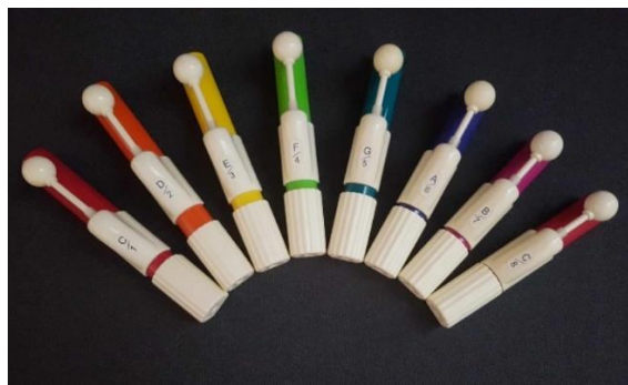
7. kép. Színes Handchimes (Fotó: Miliesz Ágnes Dóra)

A Handchimes egyelőre hangszeres előadásnál alkalmazható, a súlya miatt nehezebb megszólaltatni az óvodáskorú CP-s gyermekeknek. A harangok hangja kellemes, hosszabb-rövidebb hangok bemutatására is alkalmas.