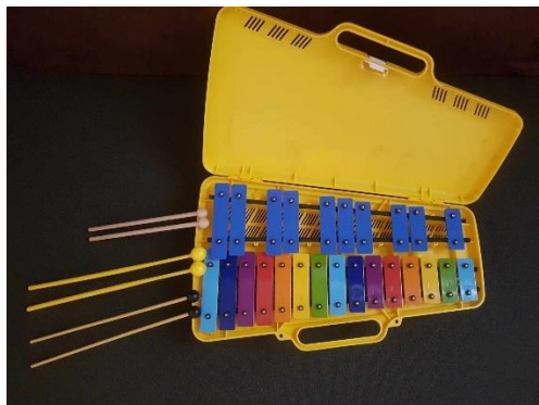
4. kép. Színes metallofon különböző ütőkkel

A színes metallofon leginkább a hangadásnál, illetve hangszeres előadásnál alkalmazható. 2019–2021 között a Semmelweis Egyetem Pető András Gyakorló Óvodájában kéthetente egy alkalommal megvalósuló ének-zenei tehetséggondozó program alkalmával a színes kotta segítségével a programban résztvevő gyermekek is képessé váltak a gyermekdalok önálló bemutatására a hangszerrel. A különböző anyagokból (fa, műanyag, gumi) készült ütők segítségével a hangszer eltérő, a gyermekek számára is érdekes hangszíneken szólalt meg.