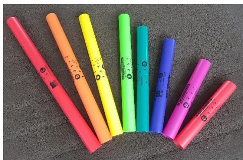
3. kép. Boomwhackers

A színes metallofon leginkább a hangadásnál, illetve hangszeres előadásnál alkalmazható. 2019–2021 között a Semmelweis Egyetem Pető András Gyakorló Óvodájában kéthetente egy alkalommal megvalósuló ének-zenei tehetséggondozó program alkalmával a színes kotta segítségével a programban résztvevő gyermekek is képessé váltak a gyermekdalok önálló bemutatására a hangszerrel. A különböző anyagokból (fa, műanyag, gumi) készült ütők segítségével a hangszer eltérő, a gyermekek számára is érdekes hangszíneken szólalt meg.