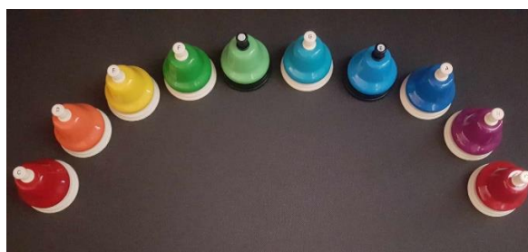
1-2. kép. Nyeles harang, kézi nyomógombos harang

A Boomwhackers (hangcső) szintén könnyen megfogható, megtartható a gyermekek számára. A hangszert üthetik számolyhoz, de akár a földhöz is. Hangja inkább tompa, nem éles, a hangingerre érzékenyebb gyermekek számára is megfelelő hangszer lehet. Alkalmazásakor differenciálhatunk a hangcső méretére vonatkozóan, illetve a színes kottában a szín gyakoriság szerint történő megjelenésében.