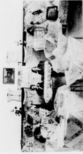
A hajduszávtói női kézimunkatanfolyam kiállításának egyik részlete.