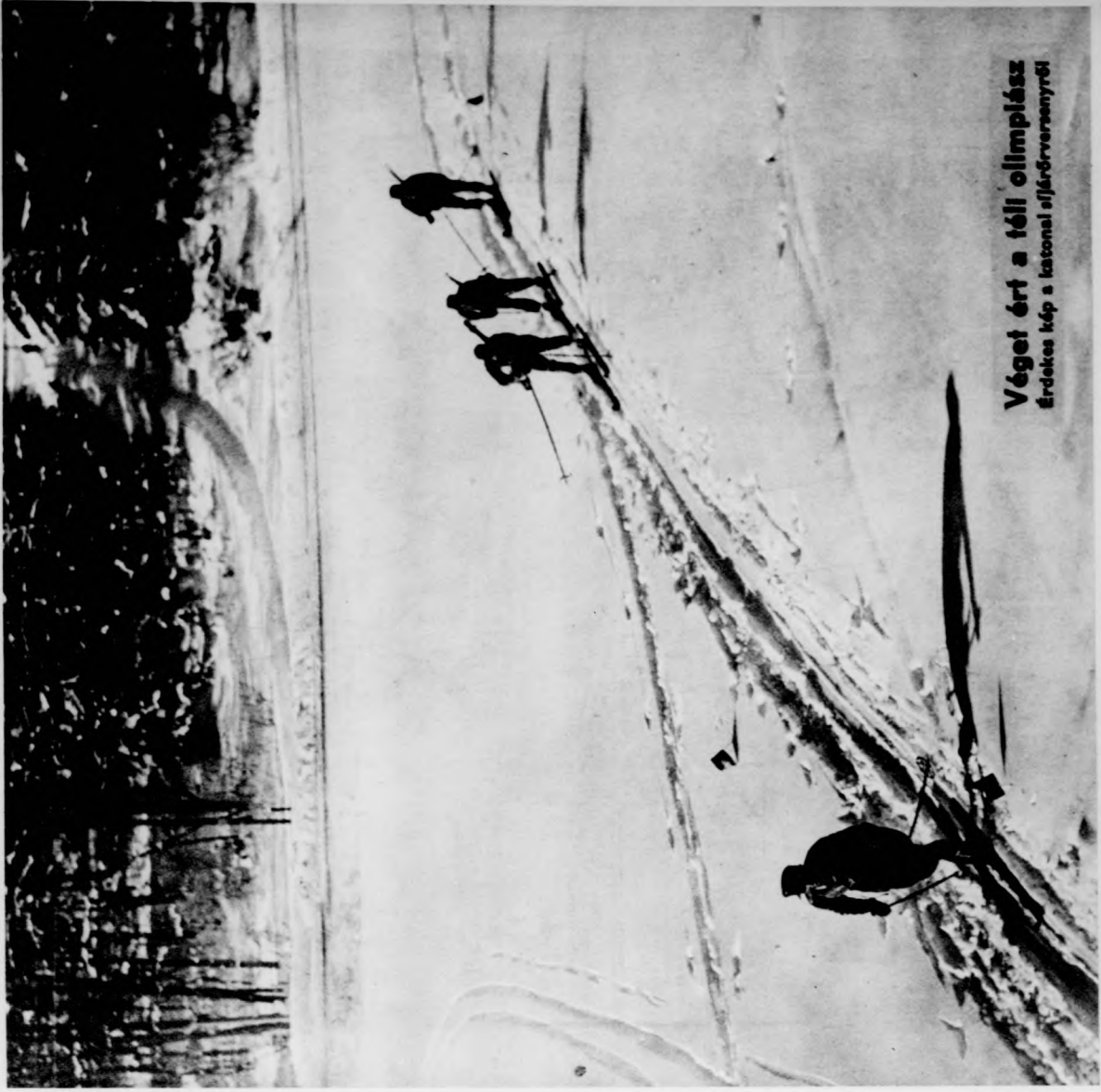
Véget ért a téli olimpiász érdekes kép a katonai előfordulmányról