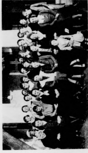
A hajduszávtói női kézimunkatanfolyam hallgatói. Középen a tanfolyam vezetői.