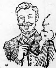
Egger mellpasztilla csak-hamar meggyógyított.