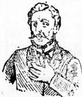
Megfojt ez az átkozott köhögés

Köhögés, rekedtség és elnyálkásodás ellen gyors és biztos hatásnak