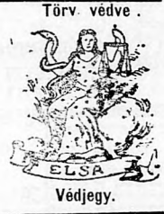
Törv. védve. Védjegy.

A valódi Feller-féle Elsa-Fluid az egészségügyi hatóság által meg van vizsgálva és jóváhagyva. A berlini, római, londoni, párisi és nizzai kiállításokon aranyéremmel tüntették ki. Csak akkor valódi, ha minden üveg az Elsa-védjeggyel van ellátva. Nemcsak betegek, hanem egészségesek is rendelik, mert az idegek erősítésére, az archór tütítésére és szépitésére, a fej mosására, korpá és hajhullás ellen és ezenkívül mint kitűnő szobalaitat is használják. Egy tucztat, (12 üveg) postán szállítva 5 kor., 24 üveg 8 60 kor., 36 üveg 12 kor., 40 f., 48 üveg 18 kor. bérmentve, utánvéttel, vagy a pénz előzetes beklüdsése után. — A ki másodsor rendel, minden 12 üveghez egy üveget ingyen kap.