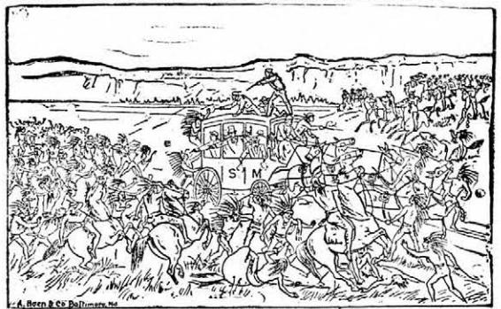
INDIANS ATTACKING THE OVERLAND MAIL COACH.

Az express pony Mexikói lovasok és lasszódobók csoportjai. 6 orslóvszék Izari arab lovasok és athletik Orosz kozákok a Kaukázusból. Fiatlú indiánok redvelt mulatagokban. Hargy kell a „Bucking Bronchos”-okra (vadlú) fellépni. A vad lovak legyőzése a lasso által. Egy kalandorok csapatjának megátámadása. Lovassági hadi gyakorlatok és katonai evolúciók. A híres deadwood gyors pósa. A cowgirls négyese löhátón. Az indiánok haditanca, 100 indiánus vörösbőrű.