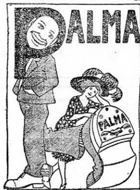
Szentes város rendőrkapitányától. 2929—Kp. 1913.

Tamlásszék 80 fill, I. hely 60 fill, II. hely 40 fill, III. hely 30 fill, Nagypáholy 4 kor., Kispáholy 3-20 kor., Diszpáholy 8 személyre 6 korona. Tíz éven aluli gyermekeknek állójegy 12 f.