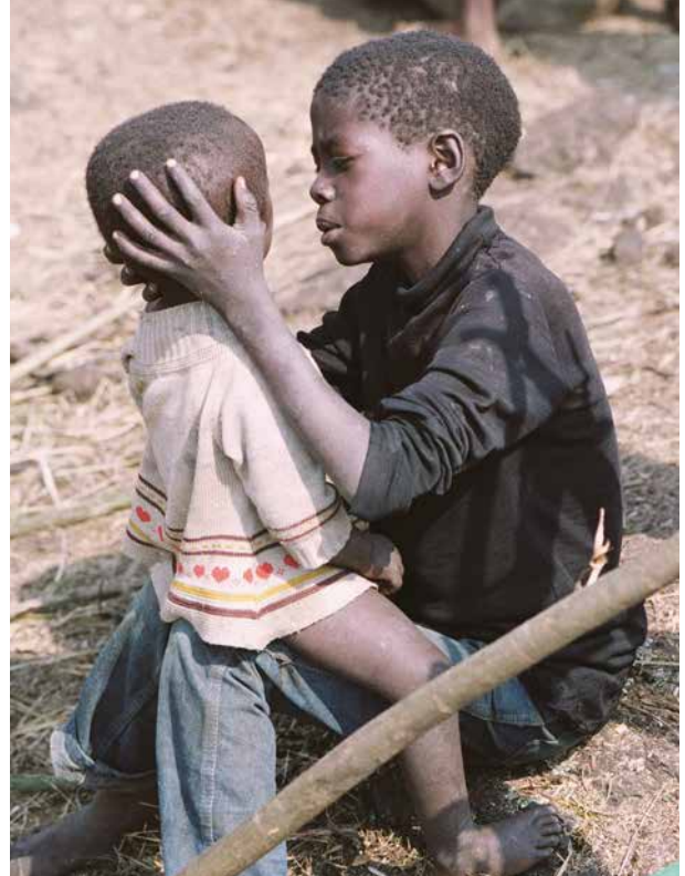
Feszültségek a függetlenség elnyerése után Ruandai gyerekek egy menekülttáborban 1994-ben, a véres polgárháború idején. A 20. században függetlenné vált afrikai országok többsége a gyarmati hatóságok által önkényesen kijelölt határokkal körülvett területeket örökölt, s ez később etnikai és vallási konfliktusokhoz vezetett