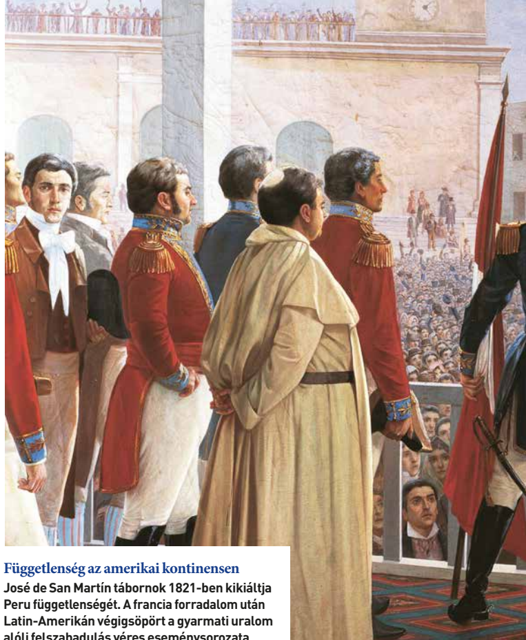
Függetlenség az amerikai kontinensen José de San Martín tábornok 1821-ben kikiáltja Peru függetlenségét. A francia forradalom után Latin-Amerikán végigsöpört a gyarmati uralom alóli felszabadulás véres eseménysorozata

A nacionalizmus egyik furcsasága, hogy a következő nagy hulláma abban az Európában indult meg, ahol ez az egész eszme megszületett, de amely a 19. század elején Dél-Amerika nemzeti-forradalmi küzdelmeiben vélte fölfedezni a követendő példát. Amikor a Habsburg és az Oszmán Birodalom elkezdett szétesni, nemzeti követelések jelentek meg, főként Kelet-Európában, Szerbiában, Görögországban, Belgiumban és Lengyelországban, s közismertté vált egy új kifejezés: nacionalizmus. A 19. század közepén a polgári forradalmak különféle okokból törtek ki, de mind a nemzeti ön-