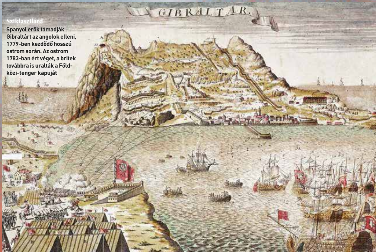
Sziklaszilárd Spanyol erők támadják Gibraltert az angolok elleni, 1779-ben kezdődő hosszú ostrom során. Az ostrom 1783-ban ért véget, a britek továbbra is uralták a Föld- közi-tenger kapuját