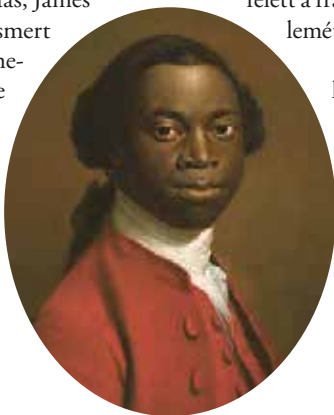
A portré feltehetőleg Ignatius Sanchót, a Londonban élő, egykori írástudó afrikai rabszolgát ábrázolja, aki ránk hagyta a háborúból fakadó zűrzavarról szóló megfigyeléseit

Franciaország, amely még mindig a hétéves háborúban és az észak-afrikai, valamint a karib-tengeri gyarmatainak elvesztése során szerzett sebeit nyalogatta, elsőként ismerte fel a vetélytársát fenyegető gyarmati polgárháborúban rejlő lehetőségeket. Amikor az amerikaiak 1777-es saratogai győzelme után egyértelművé vált, hogy Nagy-Britannia gyarmatainak valós esélye van a függetlenségükért folytatott harc megnyerésére, Franciaország az amerikai oldalra állt abban reménykedve, hogy visszazserezheti az előző háború során elveszített presztízsét, és ezzel annyira meggyengítheti Angliát, hogy tartós előnyre tehet szert a globális uralomért folytatott harcban. Amikor Franciaország 1778-ban csatlakozott az amerikai függetlenségi háborúhoz, az jelentősen megnövelte az