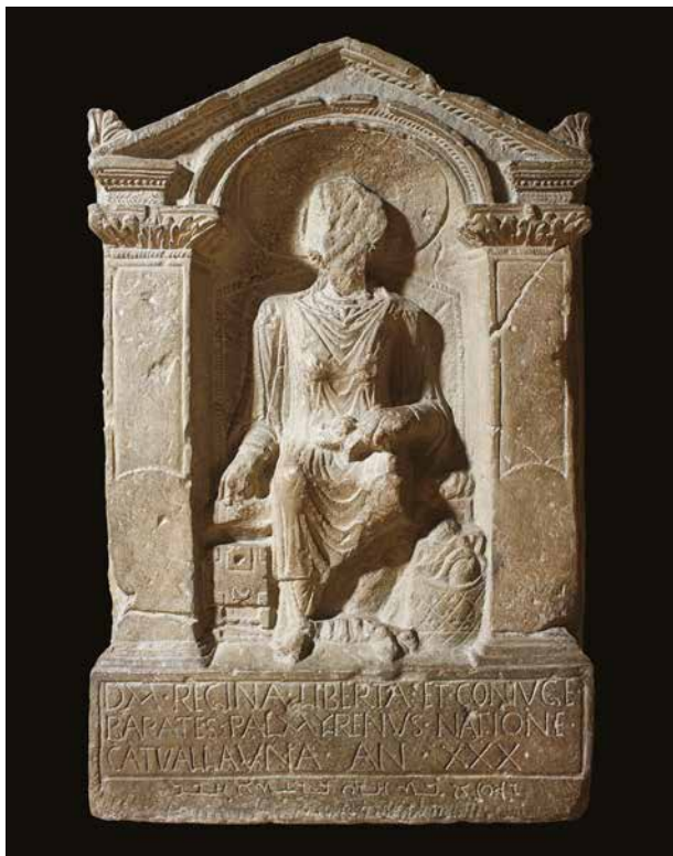
A South Shields városában talált sírkő másolata. A Britanniából származó rabszolga Reginának állít emléket, aki egy palmúrai (ma Szíria) férfi felesége lett – jól érzékelteti ez a római világ belső mobilitását és befogadókészségét