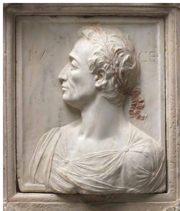
Herculaneum, i. e. 1. századi freskó: nő íróesszövevel és viasztáblával – ez volt a kódex (a lapozható oldalakkból álló könyv) előzménye. Ez a formátum váltotta föl – az itt egy 15. századi márványszobron látható – Julius Caesar hosszú kézirattekercseit. „A kódex – mondja Catherine Nixey – csak sok évszázaddal később terjedt el, de a hatása óriási jelentőségű volt.”