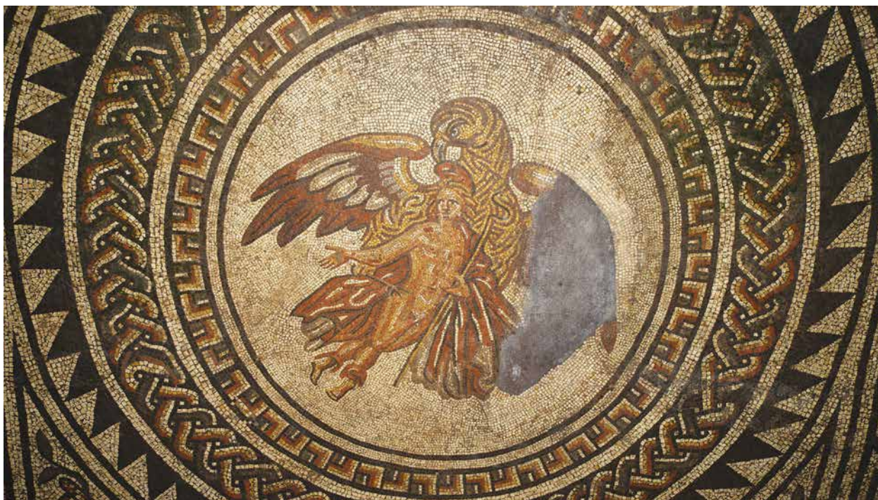
Mozaik a görög mitológia egyik jelenetével: Zeusz, sas alakjában elrabolja a trójai ifjú Ganümedészt. A nyugat-sussexi, bignori Római Villa ilyen pazar mozaikjai arról árulkodnak, hogy a britanniai háztulajdonosok is igyekeztek utánozni az itáliai gazdag rómaiak kulturális szokásait.