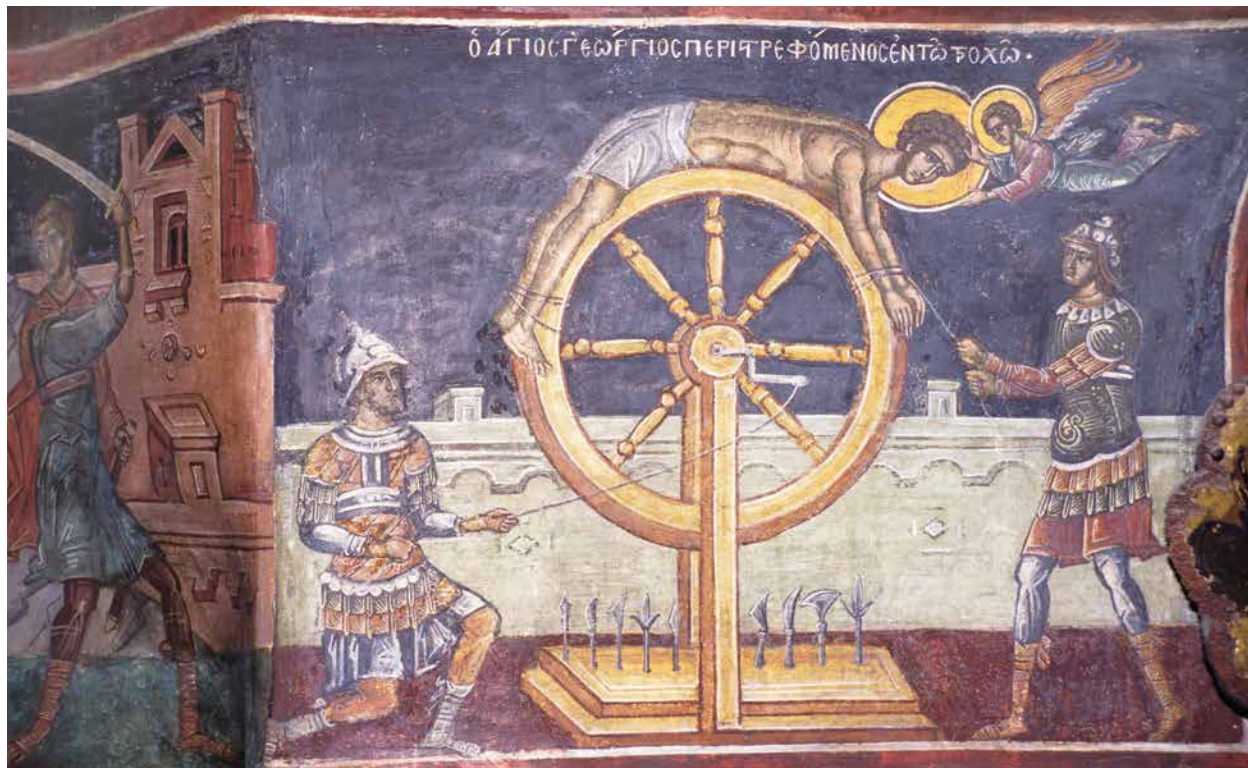
Római katonák kerékre kötözött keresztényt végeznek ki az Athosz-hegyi (Görögország) Dionüszioi kolostor egyik freskóján. Krisztus keresztre feszítésétől a korai keresztények üldözésén át Constantinus császár keresztény hitre téréséig sokat változott a birodalom viszonyulása a kereszténységhez, s ez kulcsfontosságú volt az egész római világ fejlődése és átalakulása szempontjából, magyarázza Tom Holland.