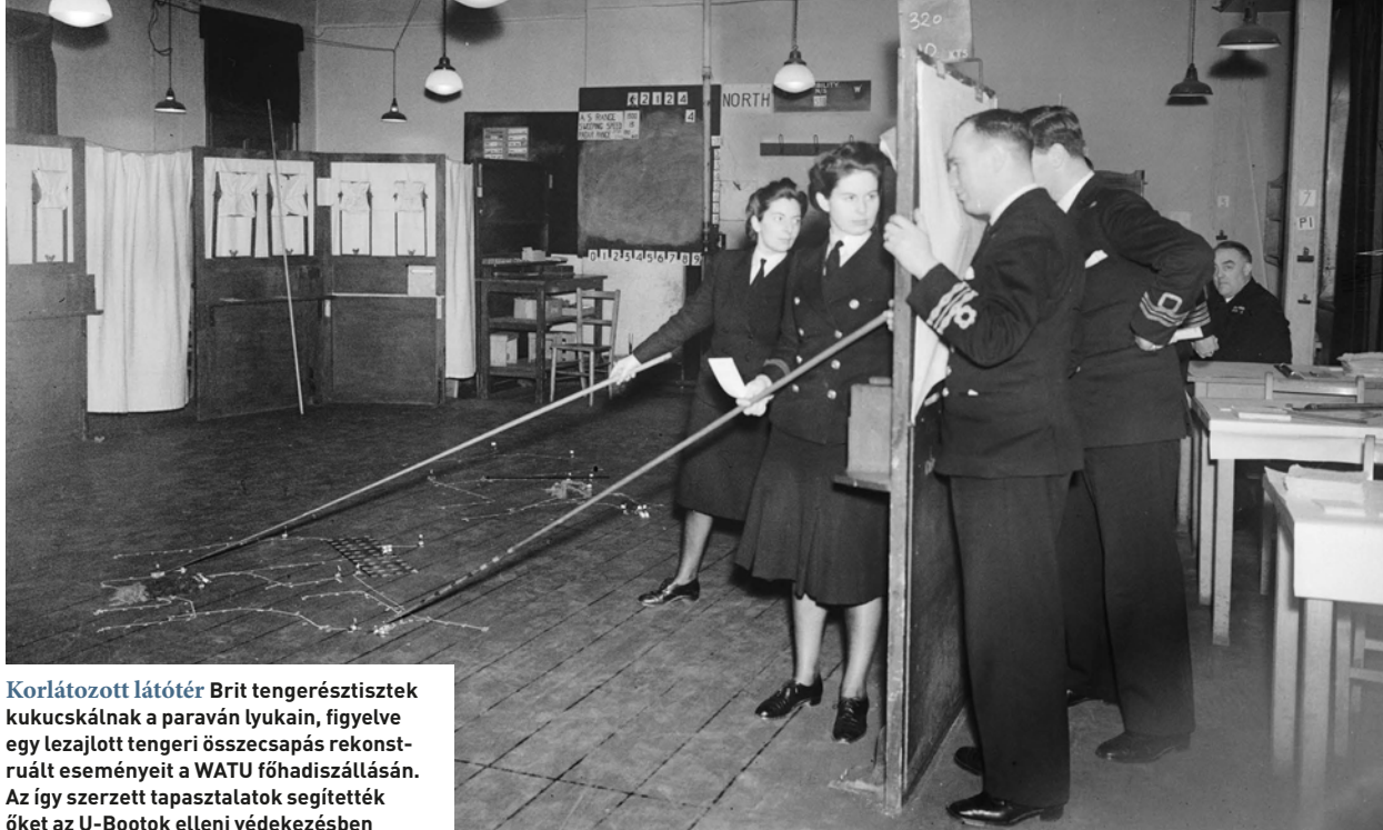
Korlátozott látótér Brit tengerészisztek kukucsálnak a parván lyukain, figyelve egy lezajlott tengeri összeecsapás rekonstruált eseményeit a WATU főhadiszállásán. Az így szerzett tapasztalatok segítették őket az U-Bootok elleni védekezésben