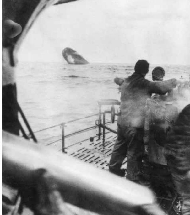
Halálos támadás Német tengeralattjáró legénysége nézi, hogyan süllyed el egy általuk megtorpedózott, majd a fedélzeti ágyúval is eltalált szövetséges hajó. A háború első két évében az U-Bootok támadásai pusztító erejűek voltak

A hajókonvojokat csapatokban támadták a német U-Bootok, ahogy a farkasfalkák is ólálkodnak a birkanyáj körül. Ahogy a veszteségek nőttek – a háború kezdete óta már 2603 brit kereskedelmi és 175 hadihajót süllyesztettek el az Atlanti-óceánon –, úgy nőtt a félelem is Angliában a német farkasfalkáktól. Churchill már 1941-ben arra a belátásra jutott, hogy az egész háború végkifejlete az atlanti térségért folyó háborúzás kimene-