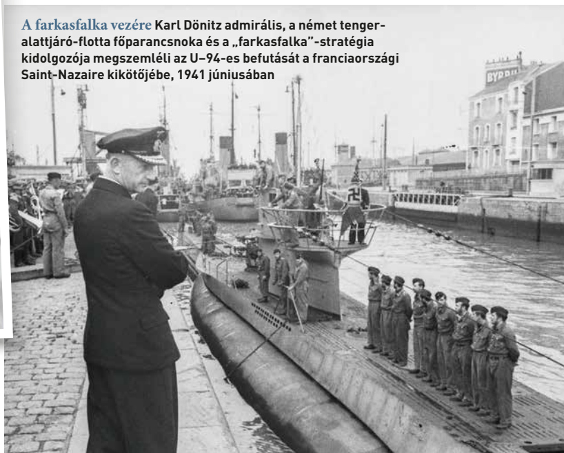
A farkasfalka vezére Karl Dönitz admirális, a német tengeralattjáró-flotta főparancsnoka és a „farkasfalka”-stratégia kidolgozója megszemléli az U-94-es befutását a franciaországi Saint-Nazaire kikötőjébe, 1941 júniusában

Sir Max Horton admirális, a Nyugati Szállítási Útvonalak parancsnoka. Eleinte nem hitte, hogy bármi értelme is volna a WATU „Játszmájának”, de jobb belátásra tért, miután több játszmányban is legyőzte őt egy ifjú wren-hölgy