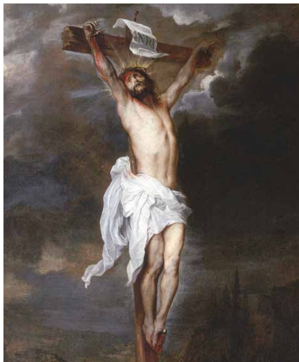
Jézus a kereszten. Anthonis van Dyck, 17. századi flamand művész festménye. „A megfeszített Jézus alakja abszolút értelemben nem, de tulajdonképpen mégiscsak meztelen – magyarázza Beard. – Ugyanakkor kissé furcsának tűnik a »meztelen Jézusról« beszélni.”

Mary Beard a görög és a latin kultúrtörténet tanára a Cambridge-i Egyetemen