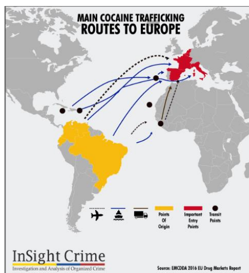
1. ábra: A kokain kereskedelmi útvonala Európába

Európába nagytöbbségben Dél-Amerikából érkezik a kokain többféle szállítási módon, repülőn, hajón illetve többféle útvonalon keresztül. Ez a tény nem meglepő, hiszen a kokacserje trópusi klímát igényel, tehát természetesen leginkább az Amazonas régióban lehetséges. A kokaint a kokacserje leveléből nyerik. Kiemelendő, hogy természetes előfordulás tekintetében Bolívia, Kolumbia és Peru azok az országok, ahol a kokacserje előfordul természetes állapotában, mesterséges telepítés nélkül. Véleményem szerint nagyon fontos és ki nem kerülendő tény, hogy a kokacserje levele, önmagában ezen területeken erőteljes kulturális szerepet játszik mind spirituális, társadalmi vagy egészségügyi értelemben is. Tehát mondhatni ezen országok számára a kokacserje nem, mint a kriminalitás egyik szegmense jelenik meg, hanem társadalmi jelentőséget nyer, és kultúra építő hatása van. Látható tehát, hogy ebben az esetben a földrajzi elhelyezkedés jelentős szerepet játszik már a kokain származási országainak vizsgálata során. Nem feledkezhetünk meg a földrajzi sajátosságokról, melyek lehetővé teszik az adott növény termesztését. Európába a származtatási országokból érkezik a kokain, leginkább Dél-Amerikából hajóval illetve repülővel. Általában Brazíliából, Venezuelából, illetve Ecuadorból indulnak a szállítmányok (EMCDDA 2016) (1. ábra).