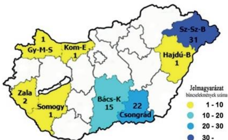
3. ábra: Védett fajok csempészete 2013 és 2018 között (Zachar (2019))

és román szakaszok (3. ábra). Itt realizálták az eljáró hatóságok a legtöbb csempészt az elmúlt években.