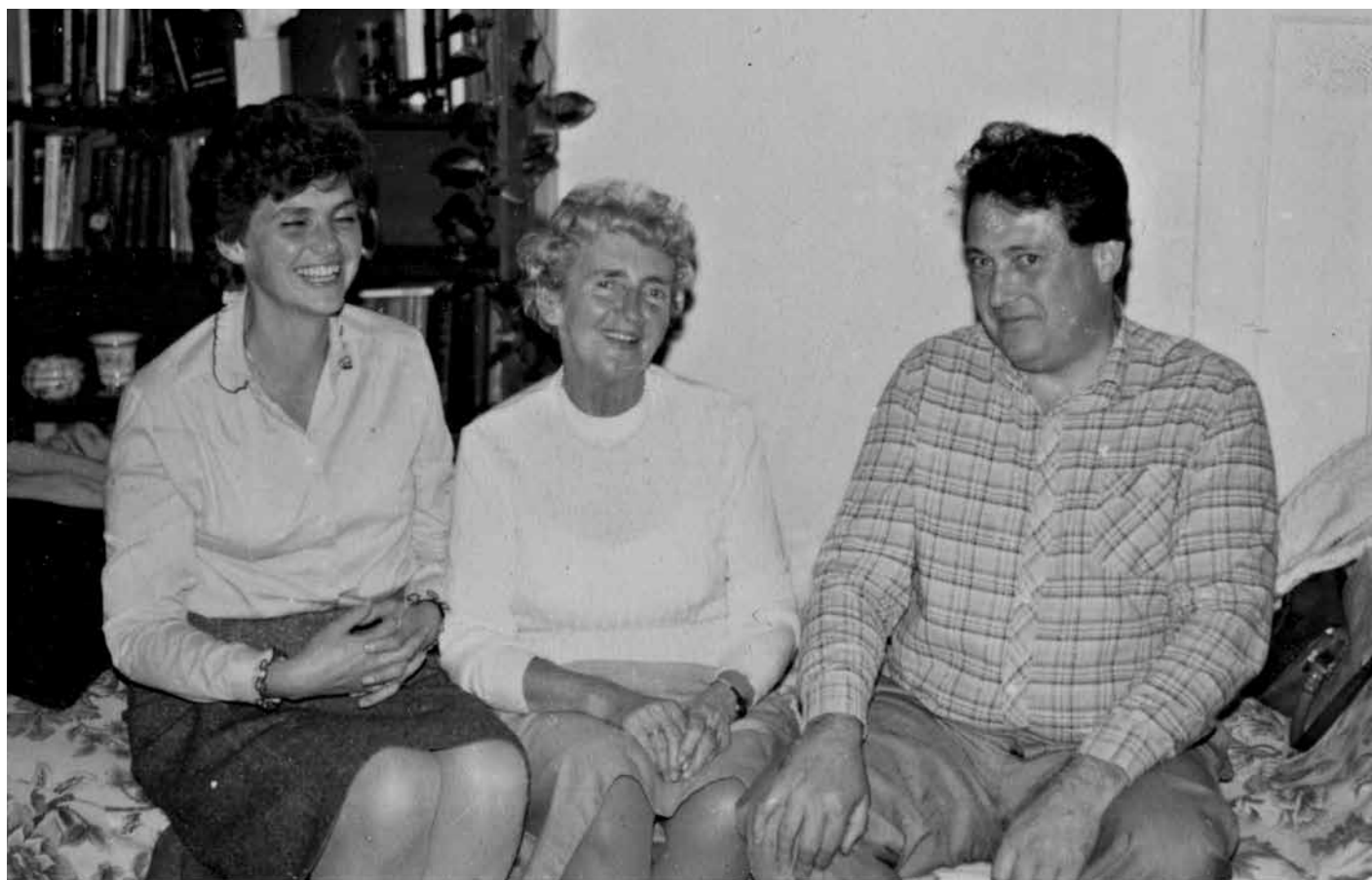
A 90 éves édesanya két gyerekével

– Hát, ha jól meggondolom, talán a csángók! '66-ban, amikor először jutottam be Moldvába, akkor már az agrár-egyetem Mezőgazdasági Építészeti Tanszékén voltam műszaki ügyintéző, mert amikor még sertéstelepen voltam, először gyakornok, aztán brigádvezető, akkor ott az agrár-egyetem, nem tudom, hogy miért pont oda, tervezett egy úgynevezett klímaistállót. Akkoriban ez divatos dolog volt, a nagyüzemi állattartás módszerei akkor kezdtek kialakulni, és rengeteg nagyüzemi istállót kellett építeni. Ekkor került előtérbe az a szemlélet, hogy az állat komfortérzetét ki kell szolgálni, mert akkor jobban értékesíti a takarmányt, több tejet ad, jobban hízik, stb. S egy ilyen istállót építettek oda,