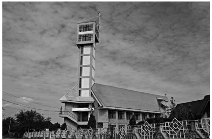
A lilijecsi római katolikus templom