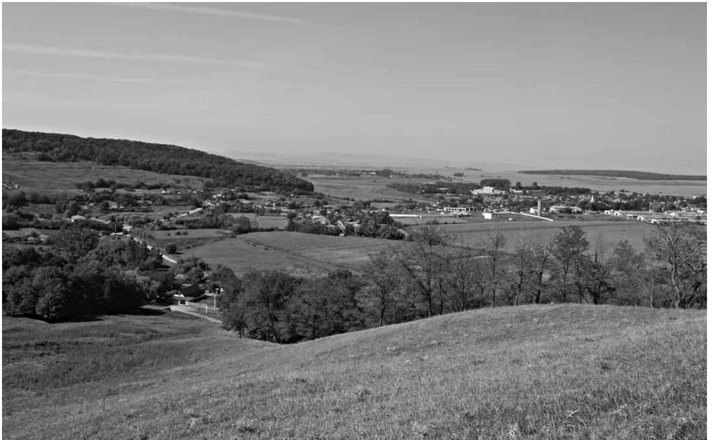
Kalugarény látképe a Kálváriáról