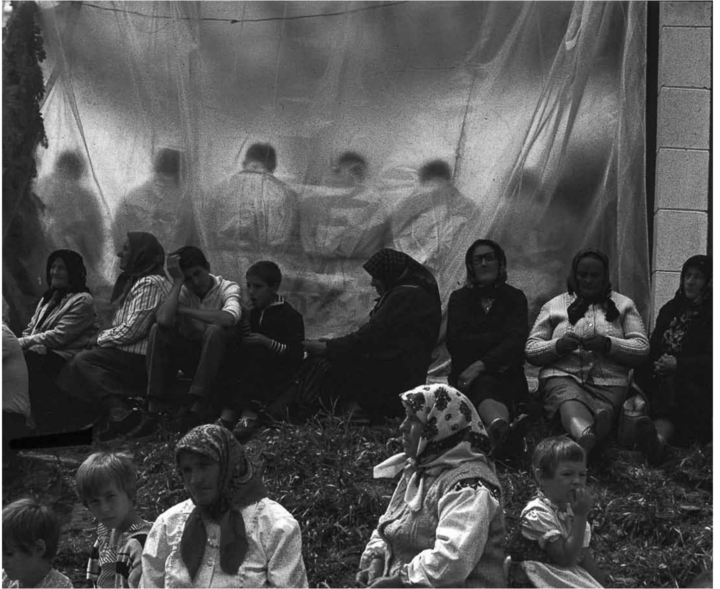
Mardzsínéni búcsú, a '90-es évek közepe