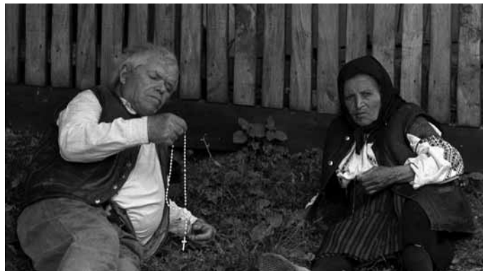
Búcsúsok Mardzsínében, a '90-es évek közepe

Rácsodálkozás lehetett a túlnyomórészt faluról érkezett egyszerű zárandokok számára az otthoni szegényes világ után az a látszólagos bőség is, amellyel Budapest utcáit járva, a kirakatokat nézegetve nap mint nap szembesültek. Ha nem