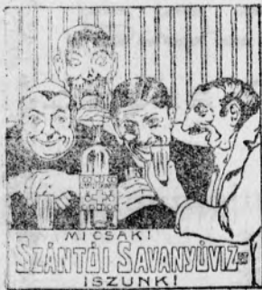
MICSAKI SZÁNTÓI SAVANYÚVÍZ ISZUNK!