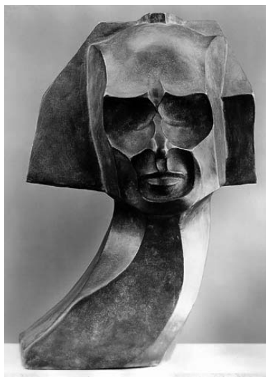
William Wauer szobra Herwarth Waldenről

Miközben Walden kiállításokat szervezett, és lapjában kommentálta őket, addig Nell megkezdte a saját gyűjteményének felépítését azzal, hogy minden Sturm-bemutatón egy festményt vagy egy grafikát vásárolt magának. Eleinte a válogatás nagy része grafikákból, rajzokból és akvarellekből