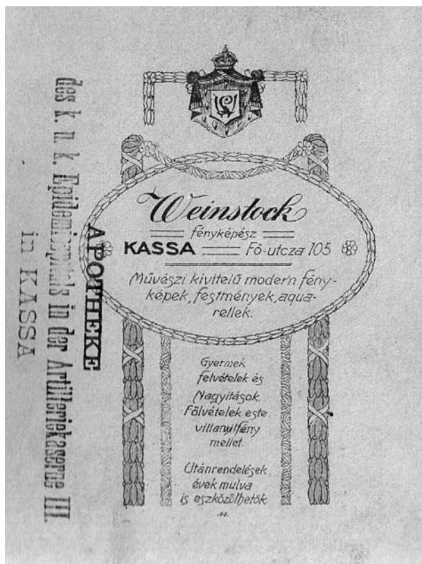
A Császári és Királyi Hadtest Járványkórház Gyógyszertárának bélyegzőlenyomata

kivételével arra korlátozódhatott, hogy a betegeket mielőbb elszállítsák gyógykezelésre a hátszországba.