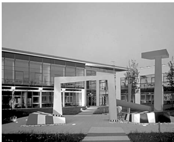
Sumer III. Kassel, 1996

– Röviden fogalmazva: a kapitalizmus és a szocializmus pozitív elemeit akarja egyesíteni, és ezt az ökológiával kívánja harmonikus viszonyba szervezni. De ellentétben a zöldekkel, nem középkori álmokat követ, hanem a high-tech mellett kötelezi el magát. Ez az irány különösen az értelmiségiek körében elterjedt. A hetvenes évek elejétől a természet struktúráit, formáit, szervezési rendszereit tanulmányozva láttam, hogy a természet formailag nézve alapformákkal dolgozik, amelyekre minden visszavezethető. Ezek az alapformák a természetben rendkívül sokoldalúan variálódhatnak, a legkülönbözőbb anyagokon és élőlényeken megtalálhatók. A nyolcvanas évek elején sikerült közös nevezőt kialakítanom a természet formavilága és az általam alkalmazott Figurák és konstellációk rendszere között. Ily módon a természet formavilágát be tudtam építeni az absztrakt művészetembe. Ezzel az absztrakt művészet és a természet formavilágának szintézisét alakítottam ki. Munkáimban három komponenst ötvöztem egymással: az