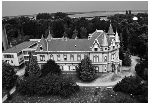
A mosdósi kórház épülete napjainkban

„1944. decemberben a szovjet hadvezetés hadikórház céljára vette igénybe az épületet. A há-