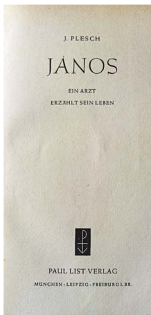
Janos Plesch: János

Hogy későbbi életkorában milyen volt? Ennek Plesch János a könyvében külön fejezetet szentel, hiszen nemcsak orvosként, hanem „házi” barátként is közel állt Einsteinhez, sőt 1944-ben Plesch megfestette (!) Einstein arcképét is. „Amikor Einsteint kaliforniai látogatásakor Chaplin városnézésre vitte, és a járókelők üdvözölték őket, akkor Chaplin ezt mondta: Az emberek ünneplik Önt, mert senki sem értette meg – engem pedig, mert mindenki megért. Ezekből a szavakból tréfás büszkeség érződik ki, de olyan érzés is, ami az olcsó populizmus és a nehezen felérhető óriás közötti különbség tudatából ered. Elsától nagyon sok és közvetlen dolgot tudunk meg Einstein-ről, aki a hétköznapi dolgokban nem valami jól igazodott el, de éppen ezekben a dolgokban Elsa szolgálója és védőangyala volt egy személyben. Amilyen éles értelemmel megfigyelt és értelmezni próbált mindent, ami körülötte történik, olyannyira szórakozott és szinte kívülálló volt a mindennapi magándolgaiban: kellett szólni, hogy ideje lefeküdni, fel kellett költeni, asztalhoz kellett hívni, majd szólni, hogy fejezze be az evést. Fagyaltevéskor nem ismert határt, egy más alkalomkor diót evett