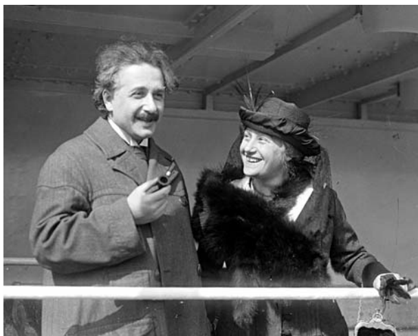
Einstein és Elsa Löwenthal

Einstein személyes véleménye a házasság intézményéről ekképpen hangzott: „A házasság intézményét biztosan egy fantázia nélküli disznó találta ki.” Mikor Elsa halálos ágyán fektet, és jajgatott, Einstein a szomszéd szobában nyugodtan tovább dolgozott. „Megtanultam ellenállni a könnyeknek” – mondta, egy másik alkalommal később. A legfontosabb és egyetlen nő Einstein életében, aki szellemileg méltó volt hozzá, kétségtelenül Mileva volt, akinek egyik levelében ez olvasható: „jobb az ő karrierjének, ha nem állok útjában”. Egy másik levelében pedig ezt írta: „az egyik kapja a dobost, a másik a gyöngyöt” – ez házáséletükre vonatkozott. Mileva szerepével kapcsolatosan azonban dokumentált, hogy Mileva apjának – aki kitűnően beszélt németül – Einstein a következőket mondta egy alkalommal: „Mindent, amit tettem és elértem, Milevának köszönhetek. Ő az én zseniális inspirátorom, védőangyalom az élet kárhozásai ellen és még több a tudományban. Nélküle a munkámat nem kezdhettem volna el, és nem vittem volna végbe.”